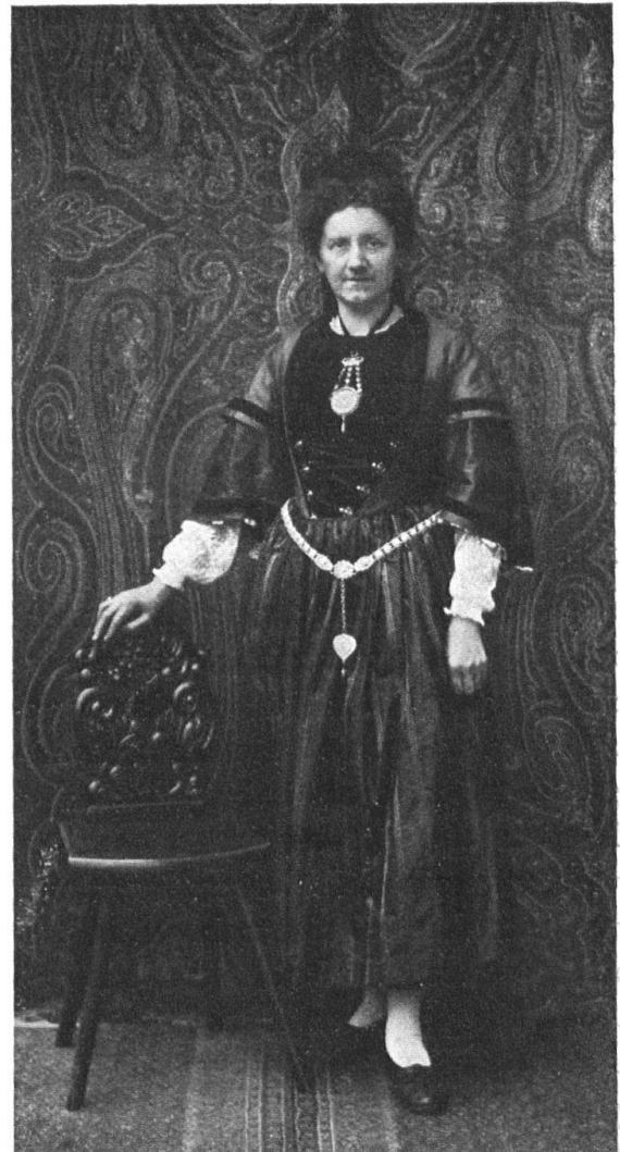
Abb. 12. Tracht von ca. 1850. Oensingen. Braunviolette Seide. Neugefärbt. — Fig. 12. Costume de 1850. Oensingen. Soie d'un violet brun. Le costume tel qu'il se porte aujourd'hui.

bei. Die Kopfbedeckung zeigte grosse Mannigfaltigkeit, nicht weniger als 7 verschiedene Arten. Darunter ist die Schnabelhaube, die wohl auf die Haube der Bürgersfrau im 16. Jahrhundert zurückgeht, ganz solothurnische Eigenart. Auch die üppige, weisse Spitzenhaube der Empirezeit, die Rosenhaube und die gesteppten „Tätschhauben“ haben wenig Aehnliches in andern Trachten. Die mehr zierlichen Häubchen des Schwarzbubenlandes erinnern in der Form an „Taufhäubchen“.