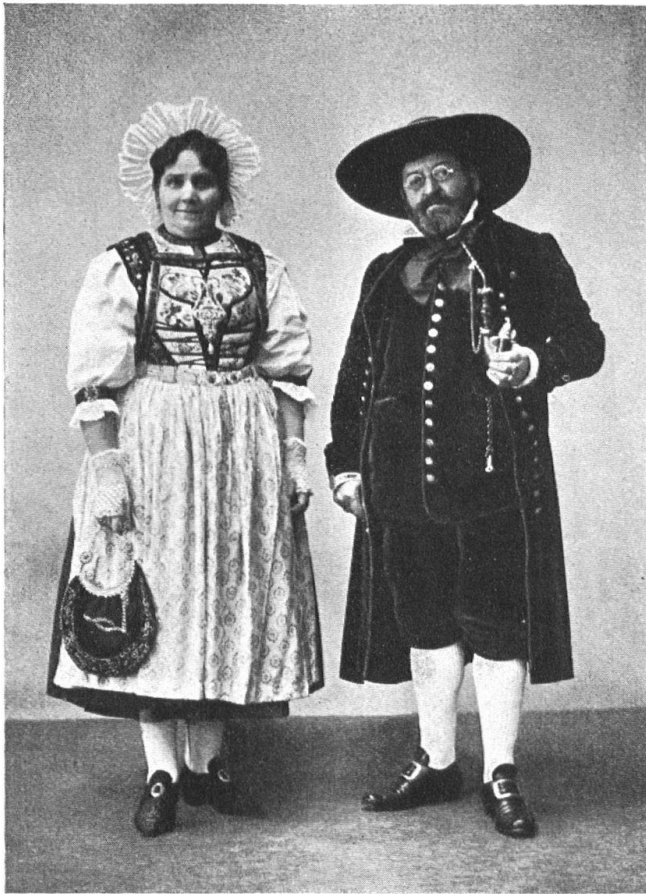
Abb. 15. Olfner Paar. Anfang 19. Jahrhundert. Neugetragen. Sammetkleid mit gepresstem Lederhut. (Gerichtsäss Wyss von Boningen.) — Fig. 15. Couple d'Olten. Costume du début du XIXe siècle. Le juge Wyss de Boningen dans son costume de velours et son large chapeau de cuir pressé.

meist stark gerefft. Der untere Rock, das Wollhemd oder der ‚Pfaff‘ stand unten handbreit vor mit rotem Band und war charakteristisch für unsere Tracht.