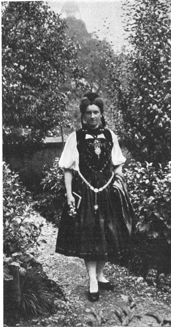
Abb. 11. Solothurner Tracht um 1830. Schnabelhaube, appretierte Wollschürze. Original im Museum Bally-Prior, Schönenwerd. — Fig. 11. Costume soleurois, vers 1830. Coiffure du temps dite «à bec». Tablier de laine apprêtée. Original au Musée Bally-Prior, Schönenwerd.