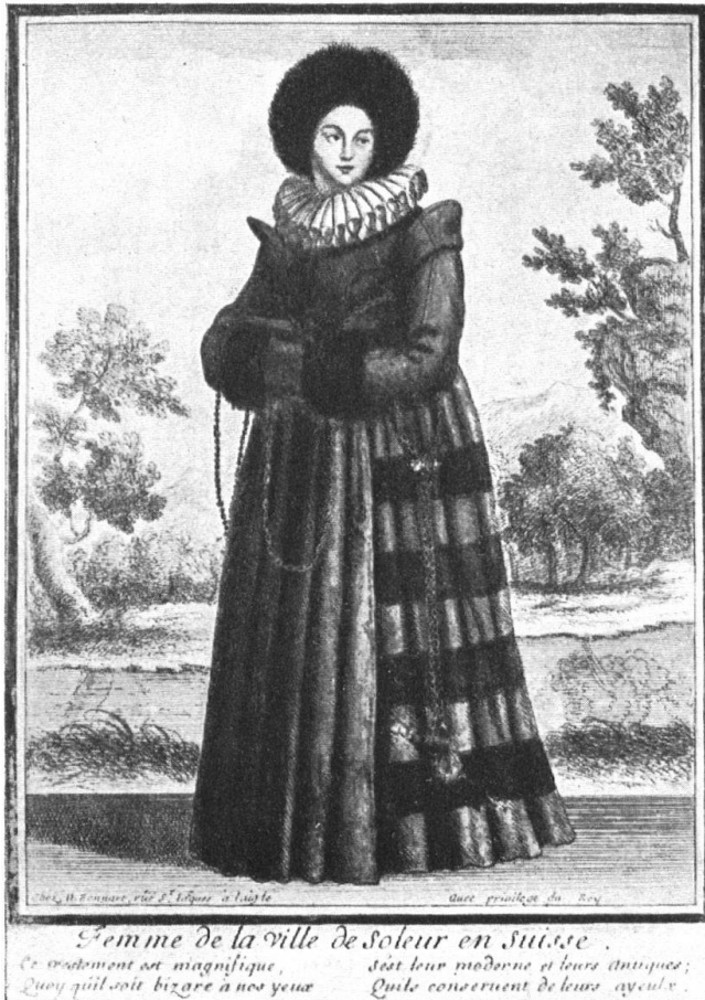
Abb. 4. Solothurner Bürgersfrau. Stadt. Mit Pelzhaube, sogenanntes „Hindesfür“, und Halskrause, sog. Krös; Barockzeit, 1640. Ziemlich allgemeine Tracht der Bürgersfrauen der Schweiz im 17. Jahrhundert. (Kupferstich, Privatbesitz, Solothurn.) — Fig. 5. Costume de Soleuroise (ville) au XVII e siècle (1640). Epoque du style baroque. Coiffure ornée de perles, grande fraise du temps, dite „Krös“. Costume de la bourgeoisie, à la mode en Suisse au XVII e siècle. Gravure d'une collection particulière, à Soleure.

König, haben daraus geschöpft, und mit allerlei Varianten, meist feine handkolorierte, graphische Blätter hergestellt, die besonders von den Fremden viel gekauft wurden.