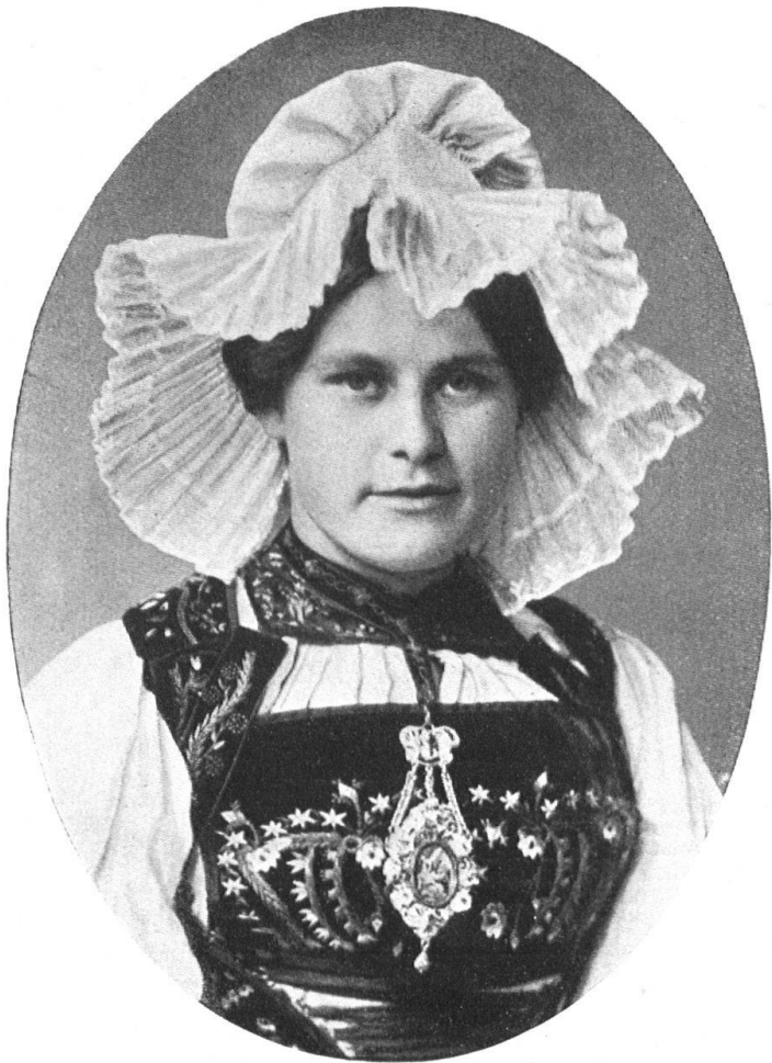
Abb. 8. Solothurner Tracht (Olten), mit weiler, weisser Spitzenhaube. Original im Schweiz. Landesmuseum. — Fig. 8. Costume soleurois, riche coiffe tuyaufée. Pendantif (Dehli). Original au Musée national à Zurich.

et Costumes suisses“, mit zwei solothurnischen, feinen, gemalten Stichen nach Dinkel folgen. Sie lautet zum ersten Bild der Margaretha Schöpli, aus dem Gasthaus zum Sternen bei Solothurn (die Sternenmey genannt), deren reizvolles Brustbild (im Ausschnitt) dieser Nummer als Kunstbeilage beigegeben ist, folgendermassen :