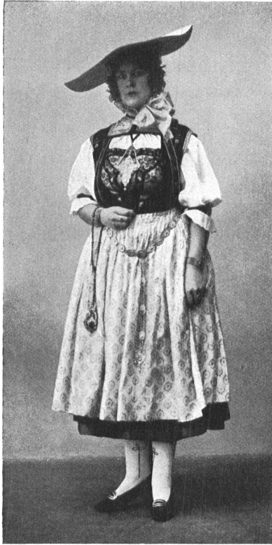
Abb. 14. Oltnermädchen in der alten Tracht von ca. 1820, neugetragene. — Fig. 14. Jeune femme d'Oltten, portant un ancien costume de 1820.

Nadelmalereien auf Seide und Sammet, ja sogar den üppigen Goldstickereien der Städterin finden sich alle möglichen Varianten, in Seide, Glasperlen- und Chenillestickerei. Als Preisnestel und Einfassungen der Armlöcher u. s. w. dienten blumig gepresste, rosafarbene oder schwarze Sammetbänder. Das Göller, ebenfalls bestickt, hatte hängende, breite Bänder unter dem Armloch durch, an Stelle der silbernen Göllerketten der Bernerinnen.