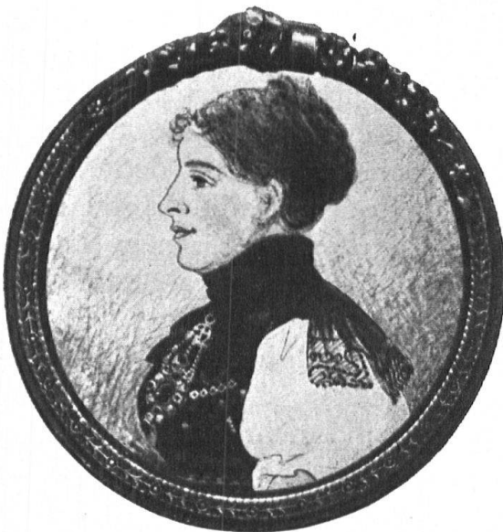
Abb. 3. Dehli mit Miniatur-Portrait. Neuendorf, ca. 1830. Fig. 3. Pendantif, dit „Dehli“, avec un portrait en miniature, datant de 1830 environ. Propriété de Mme Brunner-Walter, Granges.

für das Ländlich-Idyllische geweckt hatten, eine Reihe begeisterter Darsteller fand und eine Unmenge von Trachtenbildern entstehen liess. Sie sind freilich oft mehr malerisch-zierlich, als zuverlässig wahr. Die ältesten und besten dieser Original-Trachtenbilder sind wohl die um 1795 gemalten Trachtenbilder von Jos. Reinhart, die nun im historischen Museum zu Bern hängen. Darunter sind 4 Gruppen aus dem obern, 4 aus dem untern Kanton Solothurn stammend, letztere mit je einem Ehepaar aus Olten oder Umgebung. Andere Künstler, auch