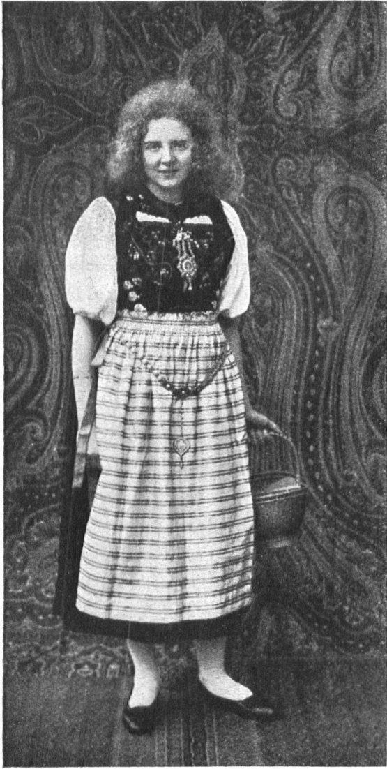
Abb. 13. Neugetragene Tracht, nach Original von ca. 1830, aus Obergösgen. — Fig. 13. Costume nouveau copié d'un original datant du 1830, environ. Obergösgen.