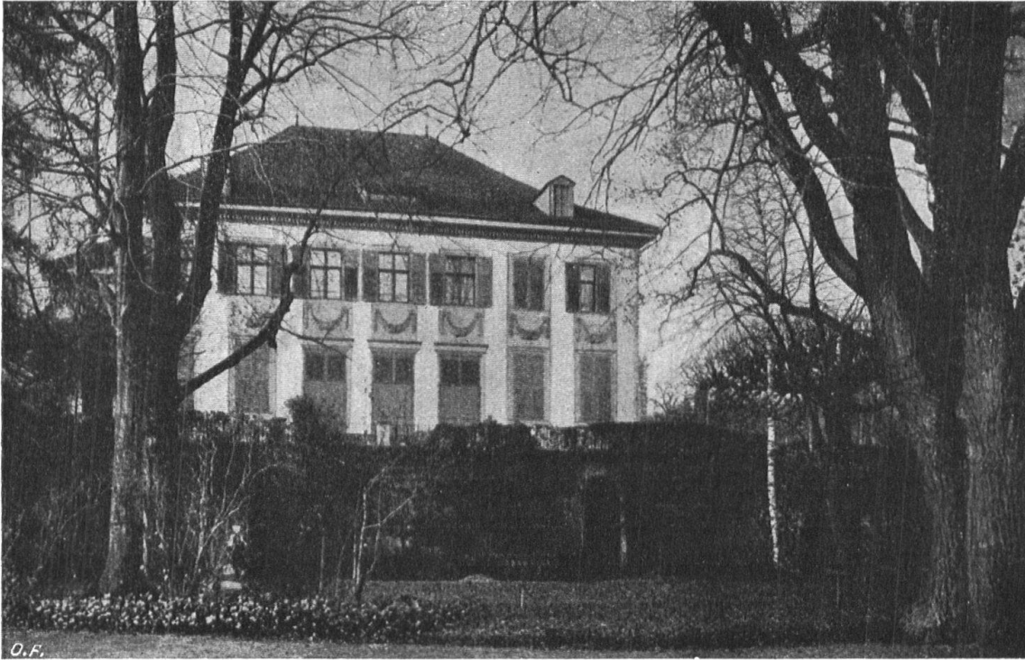
Abb. 16. Das Muraltengut in Zürich. Ursprünglich Werdmüller'sches Besitztum. Gartenansicht Fig. 16. La propriété de Muralt à Zurich, anciennement propriété Werdmüller. Vue du jardin