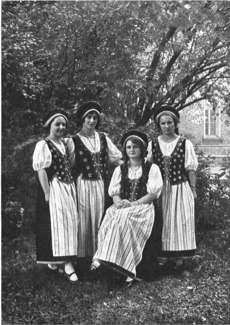
Fig. 14. L'ancien costume renouvelé du «pays du vin» (Canton de Zurich). — Abb. 14. Die erneuerte alte Weinländertracht (Kanton Zürich).

Tracht zu schaffen, die zudem farbenfroh und gefällig aussieht. An der kantonalen landwirtschaftlichen Ausstellung in Winterthur war Gelegenheit geboten, in einem eigenen Trachtenraum etliche Frauen und Töchter in der neuen Tracht betätigt zu sehen. Es herrscht allgemein Freude über den glücklichen Versuch. Die Tracht wirkt durch die ansprechenden Stücke, die aus bestem Stoff erstellt sind, durch die muntern Farben und durch die hübschen gestickten Motive am Mieder, die in Traube, Aehre und Kornblume des Weinlandes Zeichen bilden. Der Vorstand der Zürcherischen Vereinigung für Heimatschutz und die kantonale Heimatschutzkommission machten am 26. September einen Besuch im