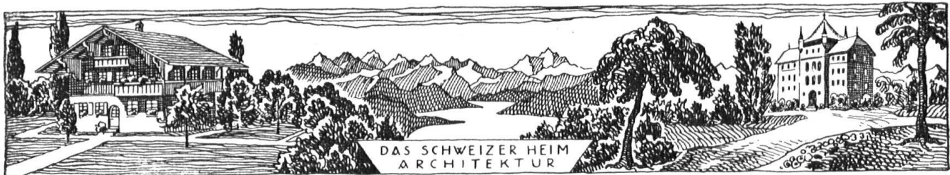
DAS SCHWEIZER HEIM ARCHITEKTUR