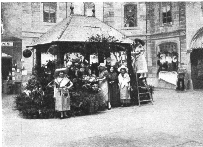
Fig. 17. Pavillon des fleurs. Les costumes des vendeuses étaient remarquables de grâce et de simplicité. — Abb. 17. Blumenpavillon. Die Trachten der Verkäuferinnen waren sehr gefällig und einfach.

plus tout à fait le cas aujourd'hui, comme chacun sait, les chapelles encombrées, tout cela n'est plus que souvenir. Tout souvenir qui s'efface tend à laisser des regrets, mais il faut convenir que l'opération était devenue nécessaire et qu'elle a été heureusement conduite. Il reste l'aménagement intérieur à réaliser, l'orgue à reconstruire, d'autres