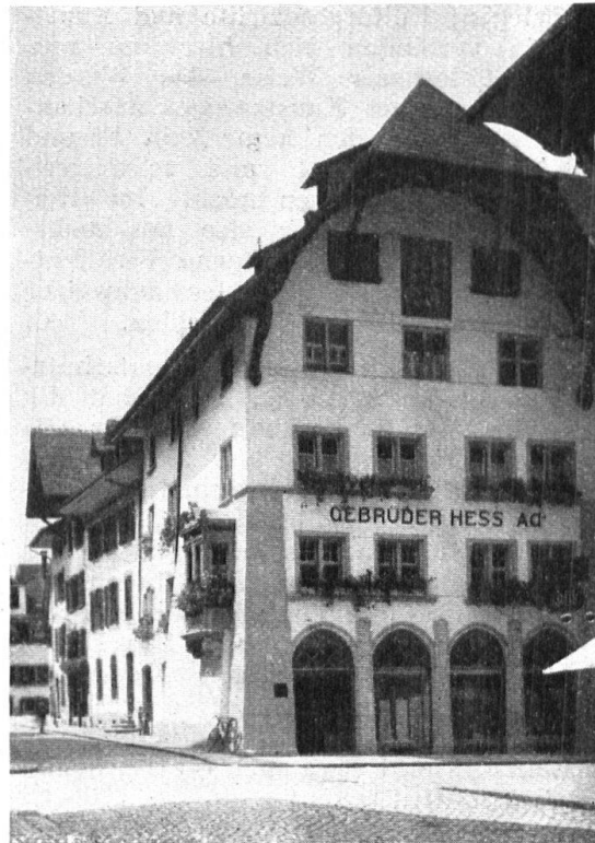
Abb. 21. Das Weibezahlhaus in Aarau, nach dem Umbau. Die Schaufenster sind mit Geschick eingebaut, allerdings der Mittelakzent geopfert. Gut angebrachte Firmenschrift. — Fig. 21. Le Weibezahlhaus à Aarau, après la restauration. Les devantures du magasin ont été habilement réparties entre les piliers. Le nom de la maison de commerce a été mis avec goût.

den Verehrer der vom Zeitalter des Verkehrs und der Industrialisierung noch unberührten Schweizer Landschaft bieten die Dutzende von trefflichen Reproduktionen eine wahre Augenweide. Städtebilder, Landschaften und Darstellungen aus dem Volksleben sind aus dem Geist jener verflossenen Tage geschaffen, wo unser Land und Volk für jeden Fremden mit einem Schimmer von Romantik und einem Hauch von Sentimentalität umgeben war. Künstler, wie Aberli, Freudenberger, Rietter, Weibel, Wetzler, Hegi, um nur die bekanntesten zu nennen, haben die schöne alte Schweiz so wiederzugeben verstanden, wie ihre Zeit und die Besten ihrer Zeit sie sahen. In Umriss-Radierungen, Aquatinten, Lithographien, die in zahlreichen Exemplaren vom Künstler und seinen Schülern koloriert wurden, so dass doch jedem der Blätter etwas von einem Original eigen war, sind diese Ansichten in die Welt hinaus gegangen, für die Eigenart der Schweiz werbend. Heute