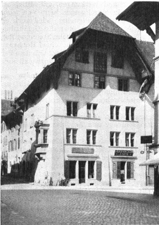
Abb. 20. Das Weibezahlhaus in Aarau, vor dem Umbau. Charakteristisch der Mittelpfeiler, zwischen den später entstandenen Magazinen der Hauptfront. Fig. 20. Le Weibezahlhaus à Aarau avant la restauration. Remarquer le contrefort qui sépare les deux magasins de la façade principale.