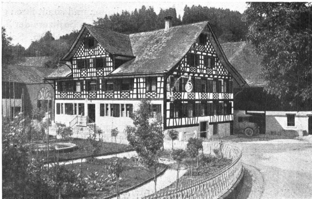
Abb. 4. Die Mühle Schönenberg bei Kradolf. Ein mächtiger, stolzer Riegelbau, der, frisch renoviert, sich mit dem Hintergrunde der Ruine „Last“ sehr hübsch ausnimmt. — Fig. 4. Le moulin Schönenberg près Kradolf. Imposante construction en colombage, restaurée dernièrement. Avec la ruine du château de «Last» à l'arrière-plan, elle produit un fort bel effet.