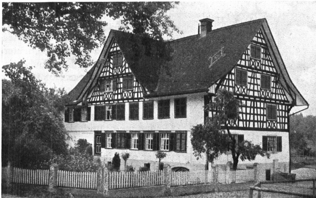
Abb. 5. Haus Lauchener in Aspenreuti, Neukirch a. d. Thur. Das Riegelwerk wurde bei der letzten Renovation wieder freigelegt. — Fig. 5. Maison Lauchener à Aspenreuti, Neukirch sur la Thur. Lors d'une rénovation récente, l'architecture en pans de bois est redevenue apparente.