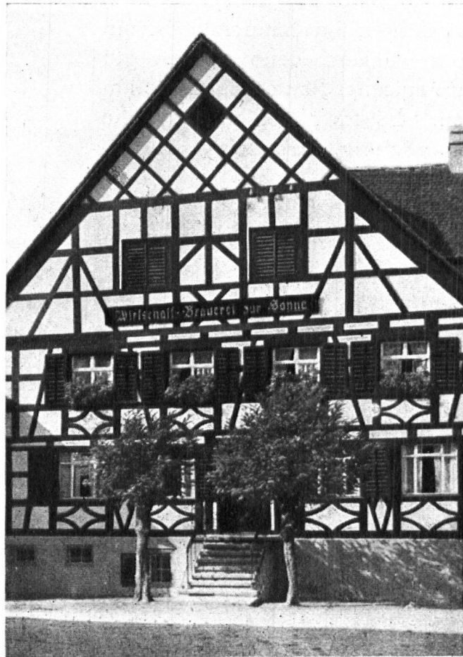
Abb. 1. Wirtschaft und Brauerei z. Sonne, Steckborn. Der Riegel wurde anlässlich einer Renovation freigelegt und heute präsentiert sich das Haus mit seiner günstigen Lage am Eingang zum Städtchen ganz vorteilhaft. — Fig. 1. Restaurant et brasserie du Soleil à Steckborn. A l'occasion de la rénovation de ce bâtiment les pans de bois du colombage ont été remis à jour. Aujourd'hui cette belle maison, à l'entrée de la petite ville, produit un excellent effet.

Die zwei Jahrzehnte Heimatschutz-Arbeit sind doch nicht ganz umsonst an unserer Heimat vorübergegangen, wie man manchmal in trübseligen Anwandlungen meint, oder wie die ewigen Nörgler und Spötter da und dort witzeln. Der Gedanke des Heimatschutzes hat entschieden Boden gefasst im Volke, das wohl fühlen mag, dass er ihm vom Besten seines Wesens retten will. Wo irgendwie Altes oder Schönes, Langvertrautes dem Zeitgeist weichen muss und dabei meist aus sehr materiellen Gründen, tönt immer wieder die Frage: Ja, und was sagt der Heimatschutz dazu? Nicht, dass wir schon im Idealzustand wären! Bewahre! Es wird auch heute noch viel altheimisches Gut den Götzen Verkehr, Entwicklung, Rentabilität und wie diese modernen Gessler alle heissen, geopfert; man könnte es mit etwas besserem Willen anders machen. Es hat auch keinen Zweck, den Heimatschutz bloss