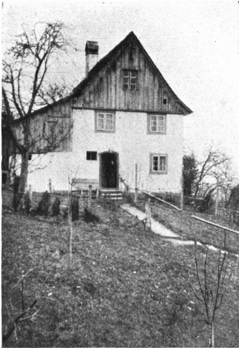
Abb. 6. Die Sonnegg in Emmishofen. Vor dem Umbau. — Fig. 6. Le «Sonnegg» à Emmishofen, avant la restauration.