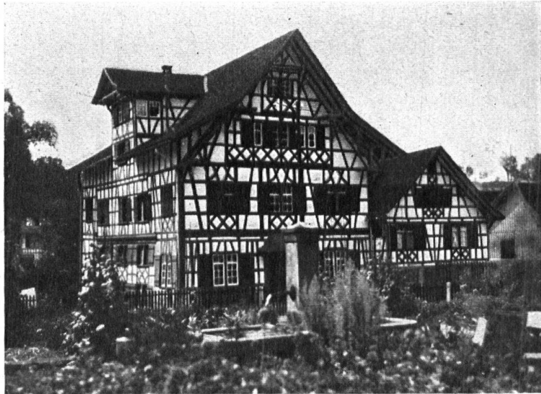
Abb. 8. Der „Spittel“ Hauptwil. Ein markanter Riegelbau mitten in der Ortschaft, der dem alten Dorfteil seinen Charakter gibt. — Fig. 8. Le « Spittel » à Hauptwil. Bâtiment en colombage, d'un beau caractère. Situé au centre de la localité il donne son originalité à la partie ancienne du village.

Bilder nicht zu fassen. Aber wir kommen ja wieder! Vielleicht beschert uns dann einmal ein Flieger eine gute Flugphoto von einem thurgauischen Dörfchen, wo fast Haus um Haus im reinen Weiss und warmen Braunrot der Riegelgiebellieb und freundlich in die grüne Welt der Obstbäume prangt.