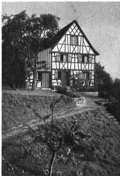
Abb. 7. Die Sonnegg, nach der erfolgreichen Renovation. — Fig. 7. Le «Sonnegg» après avoir été restauré.

Architektenarbeit zu prächtigem Abschluss gediehen und somit ihren geistigen Vätern wie den Besitzern der Bauten Ehre einbringen (Steckborn, Schönenberg, Romanshorn). Ferner diejenigen Riegelgiebel, zu welchen die Heimatschutzvereinigung zur Beratung gebeten wurde (z. B. Aspenreute, Hohentannen, Lenzenhaus).