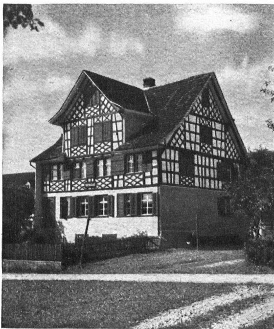
Abb. 3. Wirtschaft Lenzenhaus bei Erlen. Ein Objekt, das aus einem ziemlich baufälligen Zustande durch verständnisvolle Behandlung wieder zu seiner alten, schönen Wirkung gebracht wurde. — Fig. 3. Restaurant Lenzenhaus près Erlen. Ce bâtiment qui se trouvait dans un état de regrettable délabrement a été dernièrement restauré avec goût et a ainsi retrouvé son cachet primitif.

in Zweifelfällen aufzurufen, um ihn die Kastanien aus dem Feuer holen zu lassen, wie das oft versucht wird, denn der Vereinigung fehlen leider die nötigen Mittel, um materiell mit dem wünschbaren Nachdruck aufzutreten. Auch vermisst der Vorstand manchmal ein wenig die Rückendeckung der 800 Mitglieder bei seiner Arbeit. Die lassen ihn walten, wie den lieben Gott. Trotzdem aber, oder besser gesagt, eben darum freut man sich, wie in den letzten zwei, drei Jahren im Ländchen herum recht wackere Renovationen gut thurgauischer Bauten zustande kamen. Es mag freilich auch die Zeitströmung, sich seines Eigen-