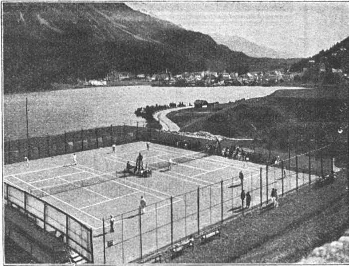
Palace-Hotel St. Moritz. Ausgeführt 1924

Anlage von Tennisplätzen System Merveilleux Langjährige Garantie Bruno Weber & Sohn Tennisbaugeschäft Basel