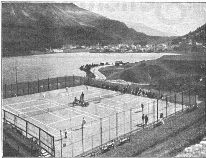
Tennisplätze Palace-Hotel St. Moritz. Ausgeführt 1924

Anlage von Tennisplätzen System Merveilleux Langjährige Garantie Bruno Weber & Sohn Tennisbaugeschäft Basel Riehenstrasse 250 Telephon Safran 20.31