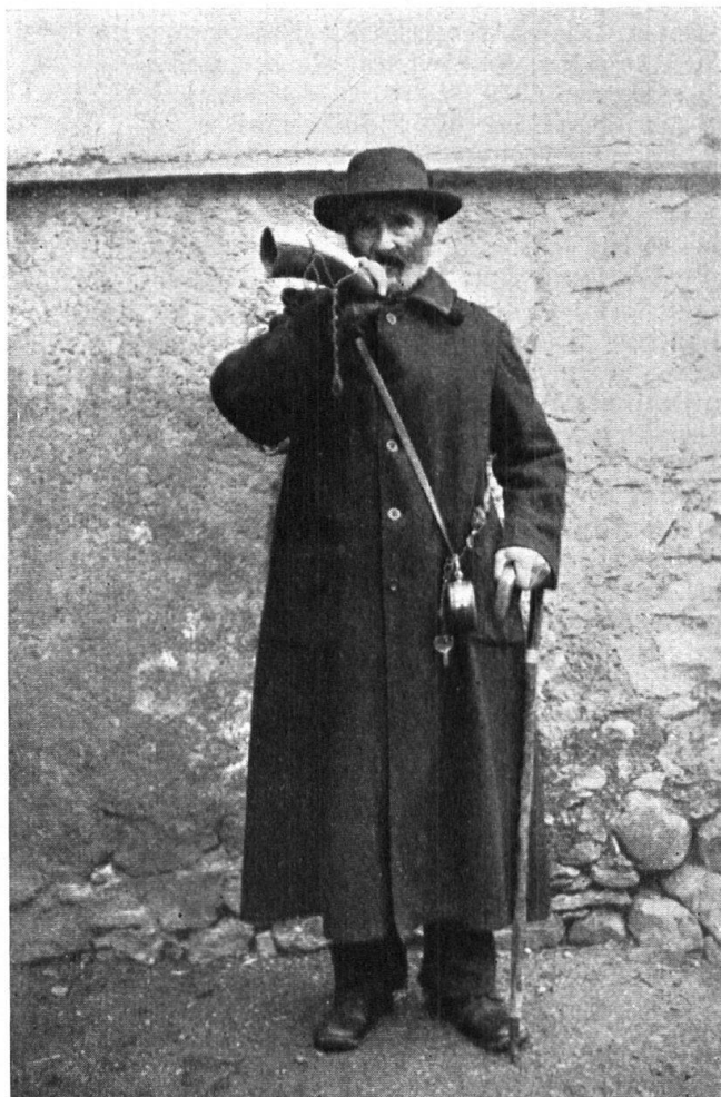
Abb. 20. Der letzte Nachtwächter des Dörfchens Berschis bei Wallenstadt ist kürzlich gestorben. — Fig. 20. Le dernier veilleur de nuit de Berschis près Wallenstadt est mort dernièrement.

In vieler Hinsicht war Schweden bis dahin ein Paradies für ausländische Antiquitätensammler, da es zahlreiche Schätze an alten Objekten besitzt. Gegenwärtig macht sich in Schweden eine nationale Bewegung geltend, die dahin geht, alle Denkmäler und Ueberbleibsel aus früheren Zeiten zu bewahren und zu erforschen. So werden dem Freiluft-Museum von Skansen in Stockholm aus allen Landes-teilen fortwährend alte Hausbauten zuge- stellt. Eine kürzliche Besichtigung der alten schwedischen Kirchenschätze ergab einen Wert von mehreren Millionen Kro- nen. In der letzten Zeit wurden in ver- schiedenen Provinzstädten Museen erstellt und das nordische Museum in Stockholm erwirbt beständig alte Kunstgegenstände. Die alten schwedischen Trachten, wie sie