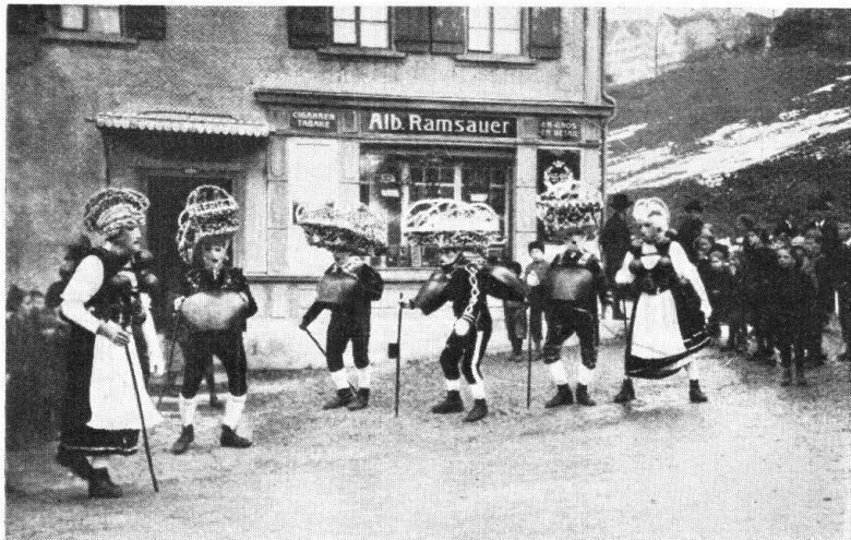
Abb. 9. Silvesterkläuse aus Herisau: neuzeitlich entartete Kostümierung. — Fig. 9. Les mascarades de la Saint-Sylvestre à Herisau. Costumes modernes d'un goût dégénéré.

Demgegenüber hat nun eine vom Vorstand der Heimatschutzsektion Appenzell A.-Rh. auf den Silvester 1927 für Herisau zusammengestellte Kläusegruppe ursprünglicher Art zu zeigen versucht, wie einfach und dabei schlicht und doch originell und dem ehemals bescheidenen Appenzellersinn und -geist besser angepasst jene früheren Silvesterkläuse waren, deren sich ältere Leute noch gerne erinnern. Diese Heimatschutzkläuse, für welche sich acht Realschüler zur Verfügung stellten, haben denn auch viel Freude gemacht. Sie wurden nicht nur bestaunt, sondern auch, wie es den Kläusen gegenüber Brauch ist, mit Geldgaben in so reichlicher Masse bedacht, dass in den polizeilich für das