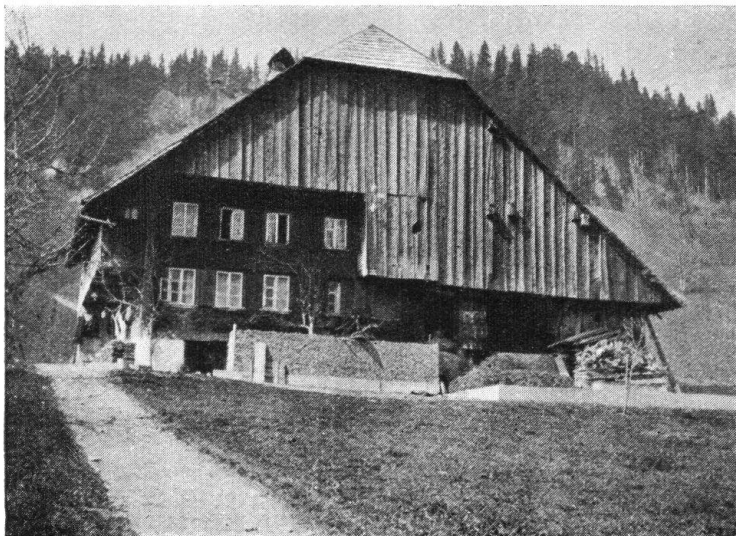
Abb. 6. Wohnhaus mit nebenangebaute Stallung. — Fig. 6. Maison paysanne avec écurie sous le même toit, à côté de l'habitation.

weise angeordnet, mit kleinen Scheibchen, die Fenstergruppen mit einer einheitlichen, ornamentalen Umrahmung versehen, in welcher die Falläden aufgezogen werden, diese und die Umrahmung mit Bemalung. An der Stirnseite ist über den Fenstern des ersten Stockes ein Vordach. Das Tätschhaus ist Rauchhaus ohne Kamin, von der Küche sieht man an die Bedachung hinauf. Die Haustüre ist quergeteilt in eine obere und untere Hälfte, die obere Türe kann für sich geöffnet werden, um dem Rauche Abzug zu verschaffen. In das obere Gemach gelangt man nicht über eine Stiege, sondern von der Wohnstube aus durch das sogenannte Ofenloch über dem Ofen.