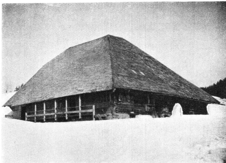
Abb. 1. Alphütte im Entlebuch. — Fig. 1. Chalet alpestre dans l'Entlebuch.

Es war einmal die Zeit der alten Schweiz, ihr Name hatte einen guten Klang bei den Nachbarn ob ihrer Eigenkraft und nationalen Eigenart als Alpenland; heute ist diese Schweiz übergegangen an die internationale, alle Unterschiede verwischende Mode, die Eigenart hat sich in einige Gebirgstäler zurückgezogen, um allhier noch ein kümmerliches Dasein zu fristen. Ueber die Häupter unserer Alpenwelt, die allein noch zu trutzen wagt, schreitet modern London und Paris und die neue Welt. — Und wie es dem Mutterlande ergangen, so erging es der kleinen Tochter, dem wahrhaftigen Ebenbilde, dem Entlebuch. Noch Alpen- und Aelplerland bis ins 19. Jahrhundert hinein, hat das Entlebuch seinen früheren Charakter verloren. Wo sind die Alpen mit der Alpkäserei? Heute sind es moderne Genossenschaftsalpen für Jungvieh und gehören nicht einmal Entlebuchern. Wer sieht noch einen schönen Alpaufzug, die Kühe mit mächtigen Gunglen am majestätischen Halsband, der Muni mit dem prächtigen Mejen auf dem Kopfe? Der Sonntagsstaat, die Männer, alt und jung hemdärmelig, die Mutter und Töchter in schmucker Landestracht, ist uns aus der Knabenzeit noch erinnerlich, wir haben's noch selber mitangesehen. Der hölzerne Pflug, bestehend aus Geize, Grendel und