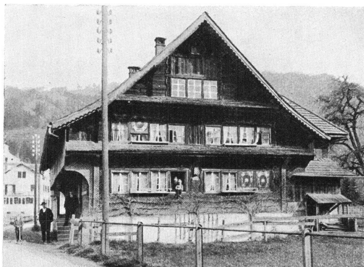
Abb. 4a. Junkerhaus in Schüpflheim. — Fig. 4a. Maison patricienne à Schüpflheim.