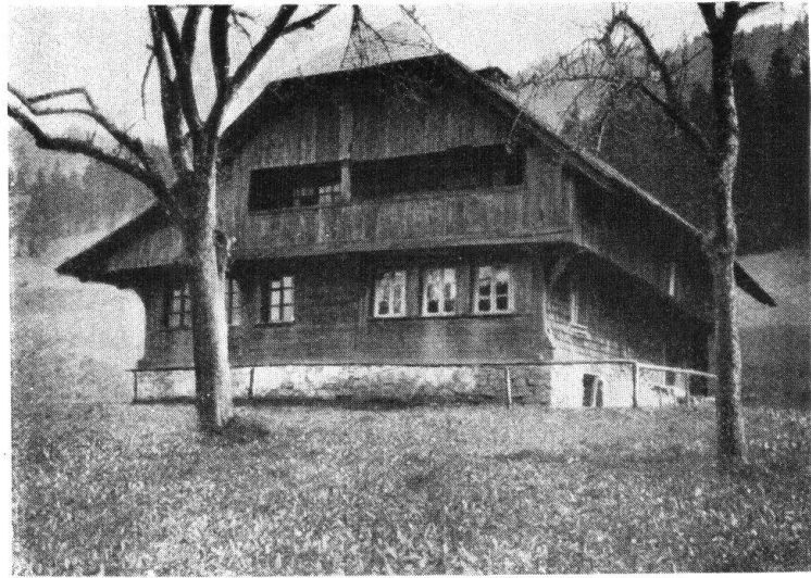
Abb. 11. Bauart in der Gemeinde Marbach. — Fig. 11. Type de la commune de Marbach.

schilt, der dem Gebäude einen alpinen Charakter verleiht, sowie die vorn, oft auch seitlich verlaufenden grossen Lauben. Der ältere Typus ist noch Rauchhaus mit auf dem Dache sichtbarem, auf- und zumachbarem Rauchabzug, die Haustüre quer geteilt. Einige in Marbach stehende Häuser dieser Bauart sind bereits mit Kamin versehen.