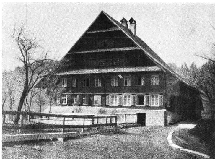
Abb. 4. Junkerhaus in Escholzmatt. — Fig. 4. Maison patricienne à Escholzmatt.

1. Die ehemalige Alphütte ist einheitlich gebaut, einstöckig mit vier gleichgrossen Dachschilden, die oben in eine Spitze zusammenlaufen und unten weit über die Wände hinaus tief hinunterreichen, so dass sie mit ausgestreckter Hand erreicht werden können. Das Dach soll möglichst gegen die Unbilden der Witterung in Gebirgsgegend schützen. Der Bau ist für Mensch und Vieh eingerichtet. Die eine Hälfte des Innenraumes hat eine kleine Stube, aller übrige Raum dient als Küche, Käs- und Milchraum. Die Liegestätte für die Aelpler ist unter dem Dach auf der Bühne, auf Streu, der Aufstieg geht von aussen über eine Leiter und Dachlucke. Eine unveränderte, typische Alphütte ist heute