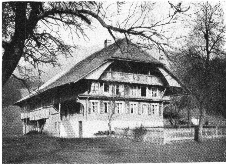
Abb. 7. Haus mit hinten angebauter Stallung und Scheune. — Fig. 7. Maison paysanne avec écurie et grange sous le même toit, derrière l'habitation.

5. Der sich ans Junkerhaus anlehende neuere Stil vor 200 bis 100 Jahren. Er ist eine einheitliche, gut unterscheidbare Bauart. Neu ist, das Dach weniger spitzgieblig, mit Querschilt und Guggeeren, seitliche Lauben, durch Täfer nach aussen verkleidet, die Fenster noch mit kleinen Scheibchen und gruppenweise angeordnet, jedoch ohne äussere Umrahmung und Bemalung. Die Vordächer auf der Vorderseite des Hauses vorhanden, die Hin-