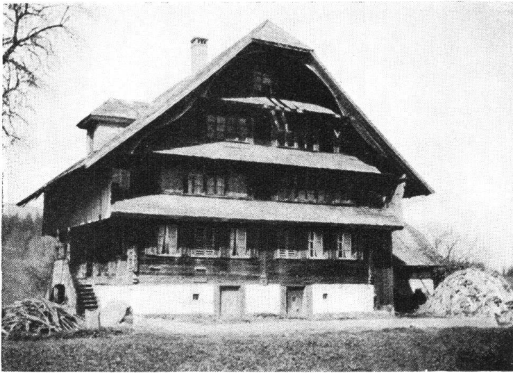
Abb. 5. Bauernhaus, im Stil sich ans Junkerhaus anlehnend. — Fig. 5. Maison paysanne dont l'architecture rappelle la maison patricienne.

weise angeordnet, mit kleinen Scheibchen, die Fenstergruppen mit einer einheitlichen, ornamentalen Umrahmung versehen, in welcher die Falläden aufgezogen werden, diese und die Umrahmung mit Bemalung. An der Stirnseite ist über den Fenstern des ersten Stockes ein Vordach. Das Tätschhaus ist Rauchhaus ohne Kamin, von der Küche sieht man an die Bedachung hinauf. Die Haustüre ist quergeteilt in eine obere und untere Hälfte, die obere Türe kann für sich geöffnet werden, um dem Rauche Abzug zu verschaffen. In das obere Gemach gelangt man nicht über eine Stiege, sondern von der Wohnstube aus durch das sogenannte Ofenloch über dem Ofen.