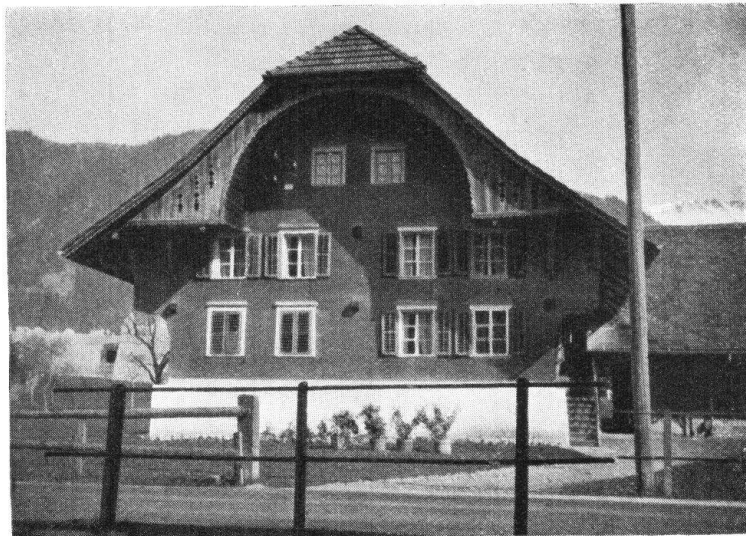
Abb. 8. Emmentaler Typus mit Rundbogen. — Fig. 8. Type emmentalois avec un pignon arrondi.