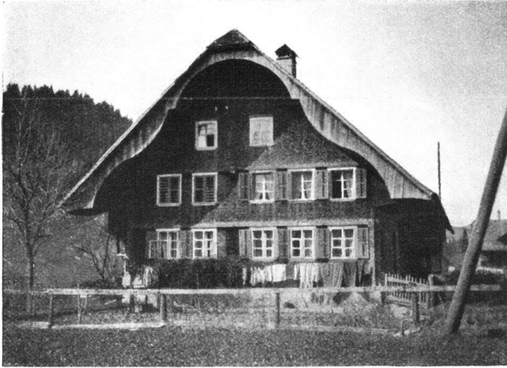
Abb. 9. Emmentaler Typus mit geschweiftem Bogen. — Fig. 9. Type emmentalois avec un pignon aux formes sinueuses.

gebildet. Es ist der Typus für geneigtes Terrain, wo es die Bodengestaltung nicht erlaubt, die Stallung mit Scheune hinten an das Haus zu setzen.