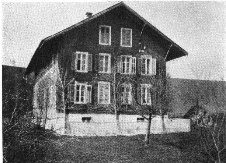
Abb. 12. Neuere, stillose Bauweise. — Fig. 12. Architecture moderne sans aucun style.

Alle die vielen Bauernhäuser, die sich nicht in einen der vorgenannten Baustile hineinfügen, sind umgebaute Wohnungen, an denen die ursprüngliche Form kaum mehr zu erkennen ist. Pfarrer Schnyder von Wartensee, gest. 1784, hat sich seinerzeit bemüht, Vorschriften und Pläne für praktische Bauernhäuser zu entwerfen, seine diesbezüglichen Arbeiten sind unveröffentlicht geblieben. Wir schliessen mit