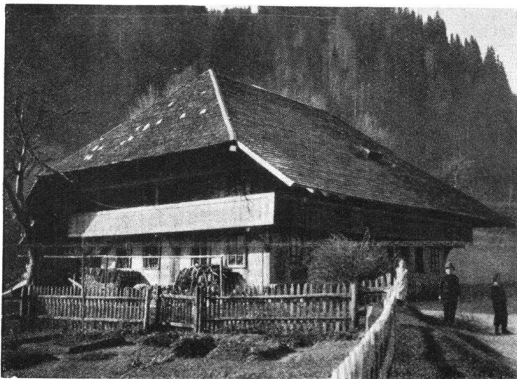
Abb. 10. Oberemmentaler Rauchhaus. — Fig. 10. Maison du Haut Emmental.

8. Die ältere und ursprüngliche Talbaute im Emmental ist diejenige mit dem Rundbogen. Im Entlebuch ist sie ziemlich selten, meist im Grenzgebiete gegen den Kanton Bern zu finden.