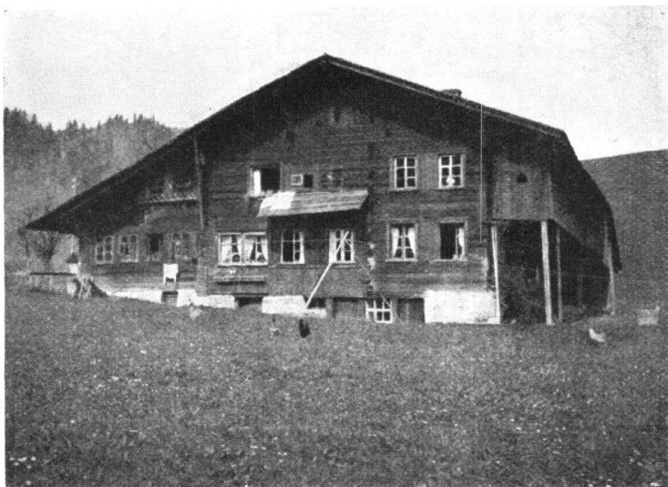
Abb. 3. Umgebautes Tätschhaus. — Fig. 3. Chalet à toit large et aplati, qui a été transformé.

erinnern sich nur noch die ältern Leute. Die modernen Drahtzieher haben ein eisernes Spinnwebnetz aufs Land gelegt und in den Dörfern und weit auf Gehöfte hinaus erheben sich städtische Bauten, auf den Strassen verkehren modern gekleidete Damen und Herren, in moderner Art, durchs Land sausen moderne Vehikel, die alte vornehme Chaise ist ein Unikum geworden. Auch die Sprache hat sich verändert, sehr viele Bezeichnungen und Wendungen, die wir in der Jugendzeit von unseren Eltern hörten, sind vollständig verschwunden und unser Sprachidiom ist ein anderes geworden.