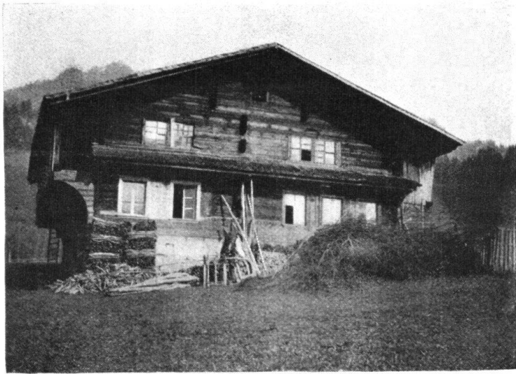
Abb. 2. Tätschhaus. — Fig. 2. Chalet à toit large et aplati.

erinnern sich nur noch die ältern Leute. Die modernen Drahtzieher haben ein eisernes Spinnwebnetz aufs Land gelegt und in den Dörfern und weit auf Gehöfte hinaus erheben sich städtische Bauten, auf den Strassen verkehren modern gekleidete Damen und Herren, in moderner Art, durchs Land sausen moderne Vehikel, die alte vornehme Chaise ist ein Unikum geworden. Auch die Sprache hat sich verändert, sehr viele Bezeichnungen und Wendungen, die wir in der Jugendzeit von unseren Eltern hörten, sind vollständig verschwunden und unser Sprachidiom ist ein anderes geworden.