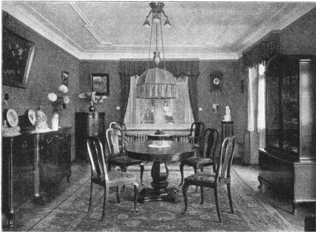
Komplettes Speisezimmer in feinem Nussbaumholz mit schönem Maser in gut bürgerlichem Wohnhaus am Zürich-Berg

orts verboten ist, wildwachsende Zweige von Kätzchenblütlern jeder Art (Weiden, Erlen, Birken, Aspen und Hasel) in grösserer Zahl abzureissen, abzuschneiden sowie feilzubieten, zu kaufen oder zu verkaufen. Fehlbare haben, z. B. im Kanton Zürich, gestützt auf die kantonale Verordnung betreffend Pflanzenschutz, bis auf 50 Fr. Geldbusse zu gewärtigen. Für Minderjährige haften deren Eltern, Pflegeeltern und Vormünder.