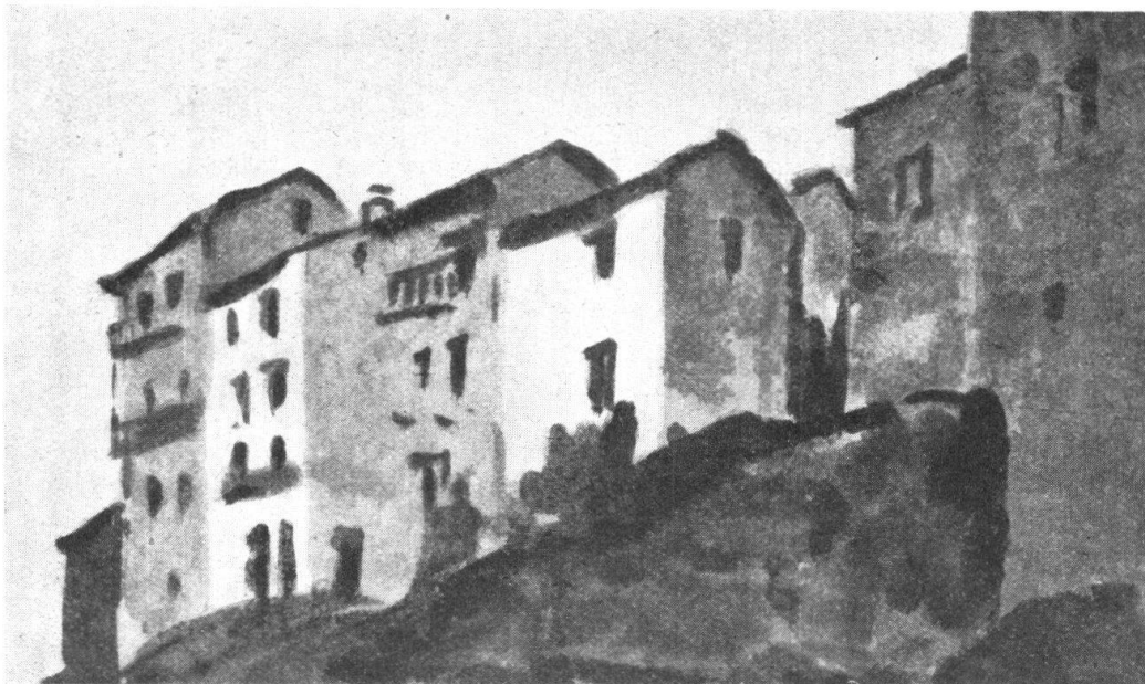
Abb. 14. Unbewohnte Häuser in Fontana Martina. — Fig. 14. Maisons inhabitées à Fontana Martina.

Wohl kehrt der Tessiner, der um ein Vermögen zu machen in die Welt hinausgezogen ist, in sein einfaches Dorf zurück und nimmt am schlichten Alltag der Familie, der alten Freunde, der Dorfgenossen wieder teil. Es kann vorkommen, dass das Dorf, wenn viele der Bewohner jahrelang fort sind, verfällt, dass es verlassen aussieht und droht, in Ruinen zu sinken.