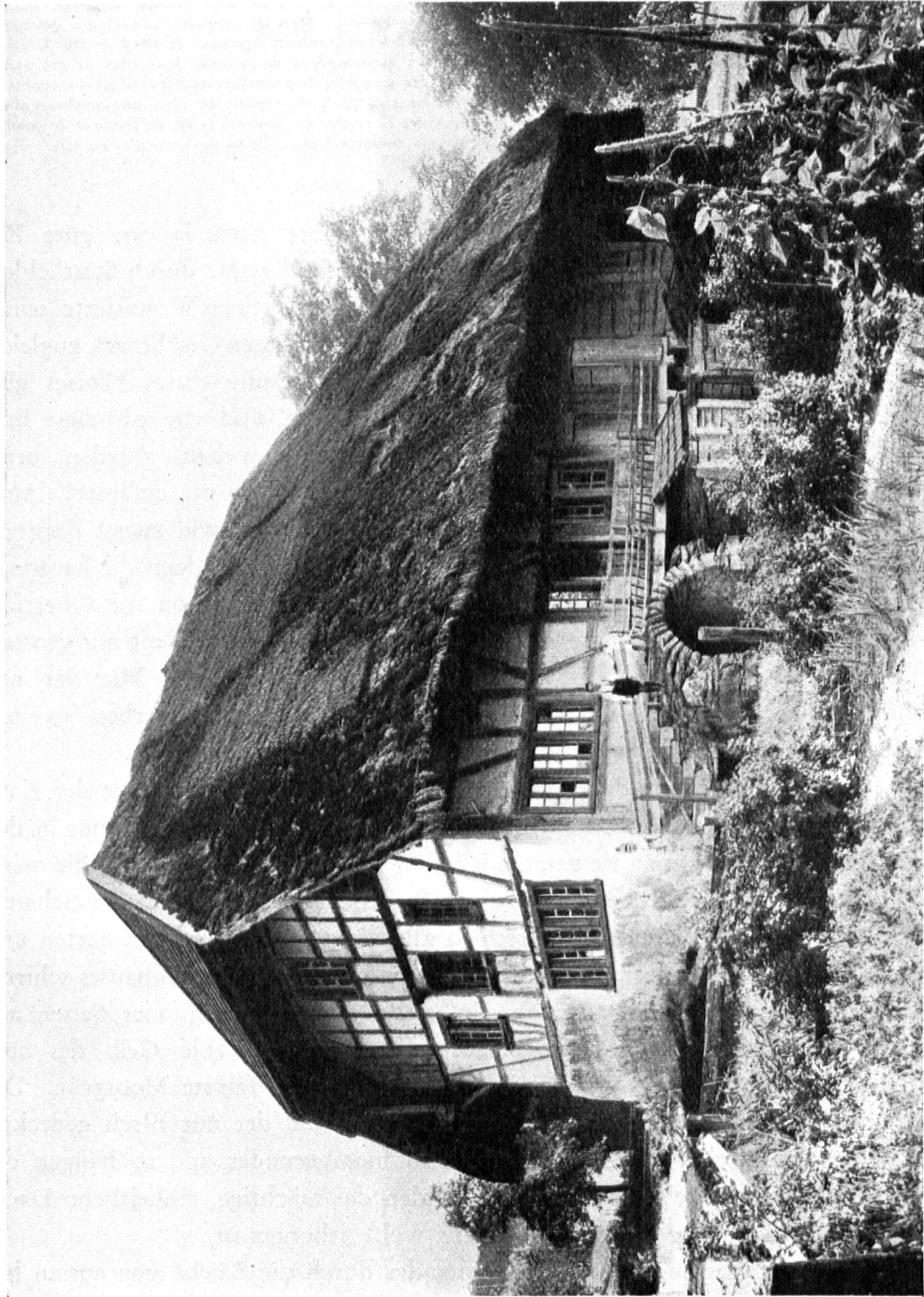
Abb. 2. Bauernhaus mit Strohdach in Hüttikon, Kt. Zürich. — Fig. 2. Maison couverte de chaume à Hüttikon, canton de Zürich.