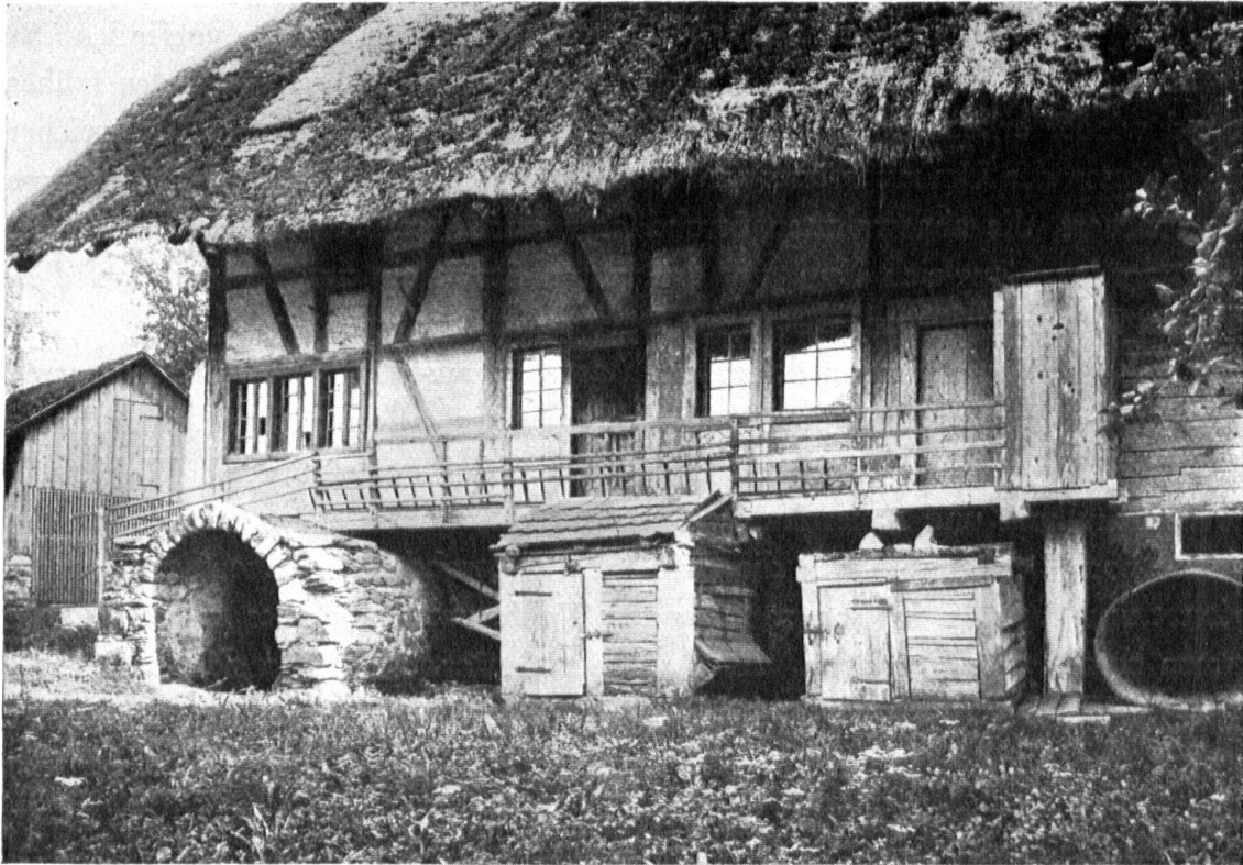
Abb. 4. Bauernhaus mit Strohdach in Hüttikon. — Fig. 4. Maison couverte de chaume à Hüttikon.

Der Rauch der Küche stieg frei in eine Art Gewölbe empor, das einen grossen Teil der Küche bedeckte. Es war dies ein aus Ruten geflochtenes, helmartiges Gewölbe, das beidseitig mit Lehm beworfen und ausgeglättet war. In dieser «Chemihutte» (Chemi = Kamin, Hutte = geflochtener Tragkorb für Rückenlasten) hingen die Speckseiten, die «Hammen» und die Würste. Zwei seitliche Oeffnungen erlaubten dem kaltgewordenen Rauch den Austritt und er verzog sich unter das mächtige Strohdach, alles Holzwerk schwärzend, zugleich aber auch die zum Binden verwendeten Weidenruten und Strohseile mit Holzteer durchtränkend, so dass sie Generationen lang ihren Dienst taten, ohne von Fäulnis angegriffen oder von Würmern zerfressen zu werden.