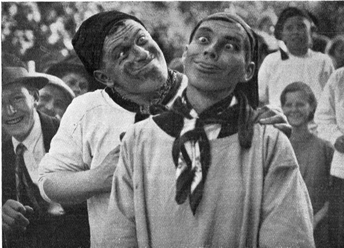
Abb. 7. Jetzt zeigte er die Zunge doch. — Fig. 7. Il finit quand même par montrer sa langue.