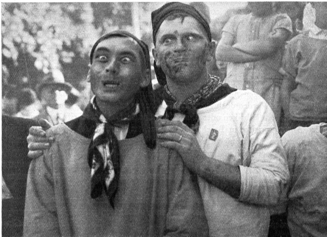
Abb. 8. Schlussbild. — Fig. 8. Tableau final.