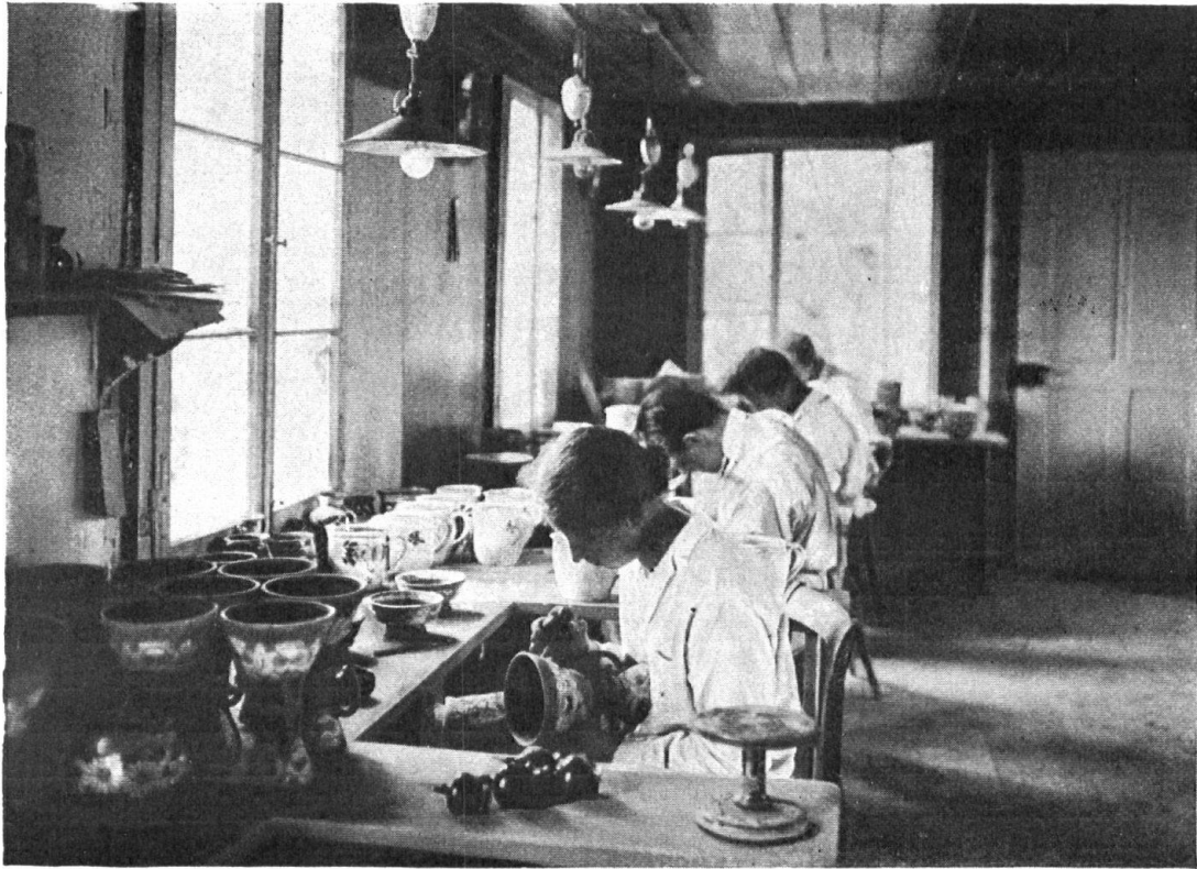
Steffisburger Töpferei Poterie à Steffisburg (Thoune)

ist die Schnitzerei ebenfalls zu Hause. Die Reiseandenken und Figuren derselben stehen künstlerisch zum allermindesten nicht höher als der Durchschnitt der Oberländerwaren. Aber sie sind viel billiger. Heute überschwemmen sie unsere Fremdengebiete. Warum wohl? Weil sie dem Handel dienen. Dieser richtet sich nicht nach Stil und Schönheit, sondern nach Verkäuflichkeit der Waren. Wendet sich unsere Schnitzerei heute von der Handelsware ab, so ist sie schon morgen durch ausländische Konkurrenzprodukte ersetzt. Wenn nicht irgend ein Weg gefunden wird, der Einfuhr entgegenzutreten, so wird unsere Holzsnitzerei neuerdings einen grossen Verlust erleiden. Neuerdings, denn durch die moderne Sachlichkeit ist die Ornamentschnitzerei bereits brotlos geworden. Und das nur einer Mode wegen. Wir wollen hoffen, dass sich auch auf diesem Gebiet wieder eine andere Richtung durchsetzt, eine Auffassung, welche für den Schmuck menschlicher Wohnstätten auch wiederum Werke zulässt, aus welchen Kunst und Schönheitssinn sprechen. Die Holzsnitzerei beschäftigte im letzten Winter noch zirka 700 Arbeiter. Schon diesen Winter wird ein grosser Teil der Arbeiter arbeitslos sein. Wir haben eine schlechte Fremdensaison hinter uns. Die Magazine sind noch genügend versorgt mit Waren. Ein harter Winter steht vor der Türe. Sorgen wir dafür, dass auf ihn wieder bessere Zeiten für die Holzsnitzer folgen. Sicher kann der Heimatschutz