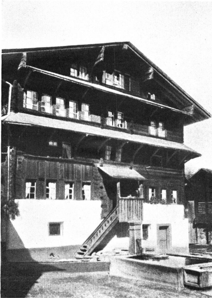
«Grosshaus» in Elm.