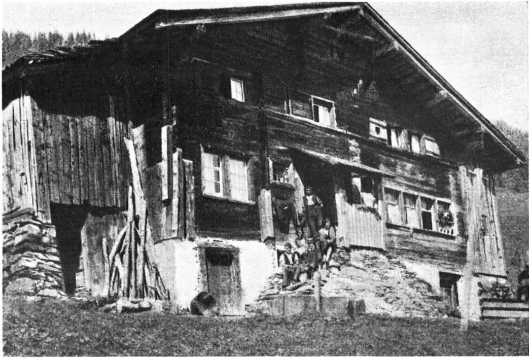
Bauernhaus in Hintersteinibach bei Elm.