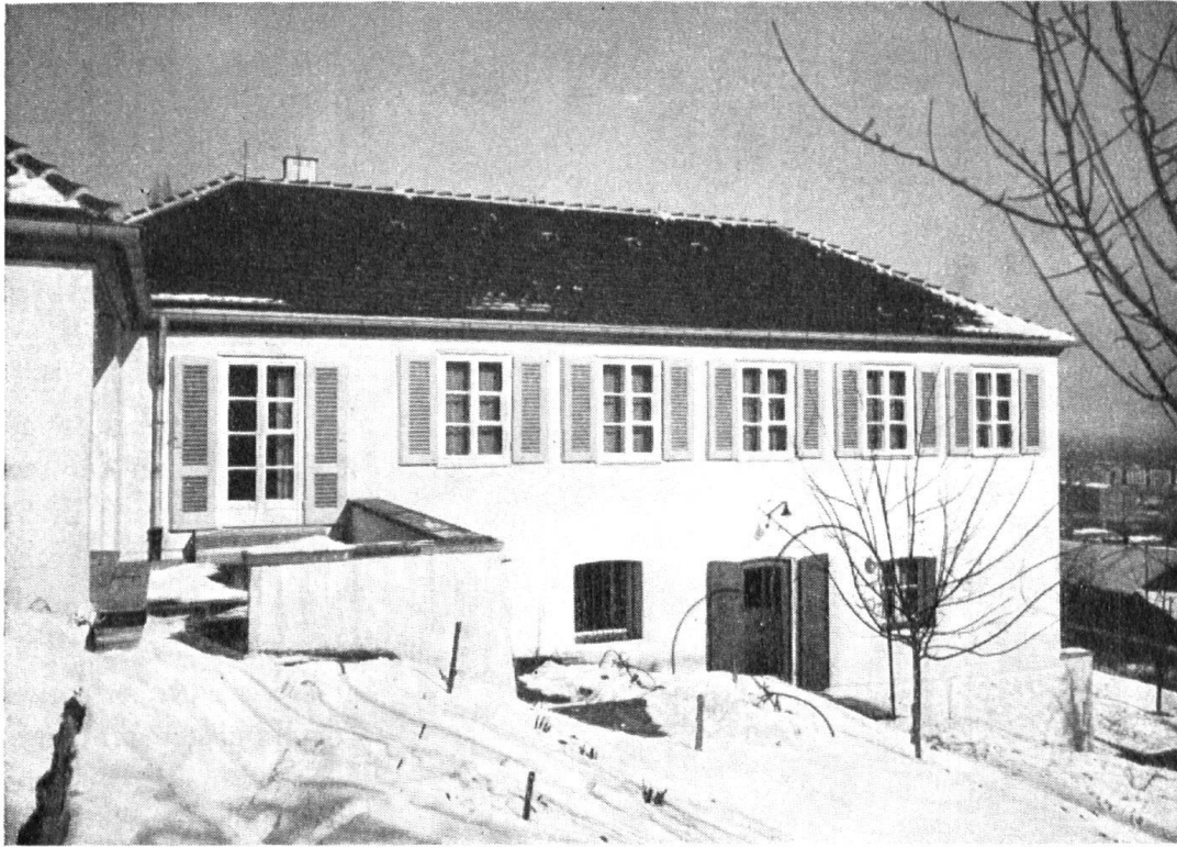
Landhaus am Hang.