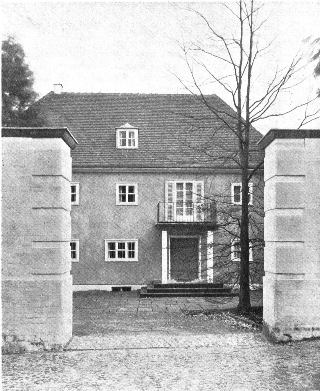
Haus mit Höfchen.