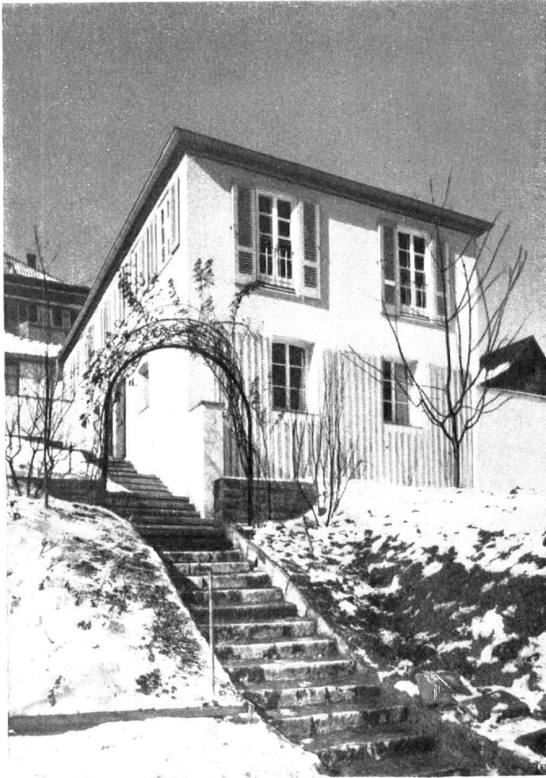
Landhaus am Hang