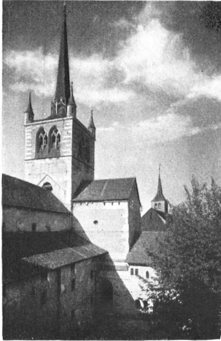
Payerne. Abbatale. Cour intérieure.

Cité agreste et laborieuse, baignée de paix rustique, Payerne est la gardienne vigilante de souvenirs glorieux et de remarquables monuments.