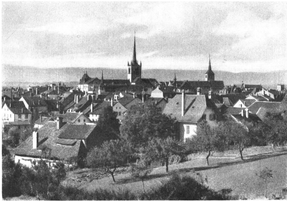
Payerne. Vue générale.