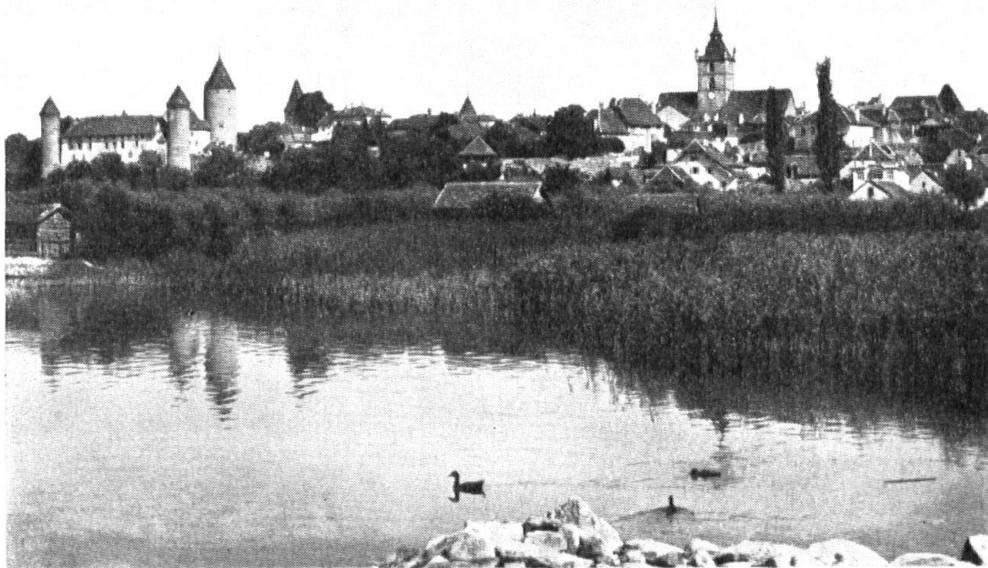
Estavayer. Vue générale.

le vindicatif qui tua en un duel Othon de Grandson, et Claude qui défendit avec courage sa ville et périt héroïquement. Le castel flanqué d'un donjon massif et gris, escorté de tours aux briques roses offre l'illusion d'un château fort avec ses fossés, ses restes de pont-levis, ses dentelles de mâchicoulis. Le clocher de l'église a une apparence belliqueuse; avec ses échauguettes en poivrière d'où monte un toit pyramidal et tronqué, on le prendrait pour un beffroi. Même le paisible monastère de Saint-Dominique, d'où depuis tant de siècles s'élèvent des psalmodies jamais interrompues et où Lacordaire séjourna, a des tours guerrières.