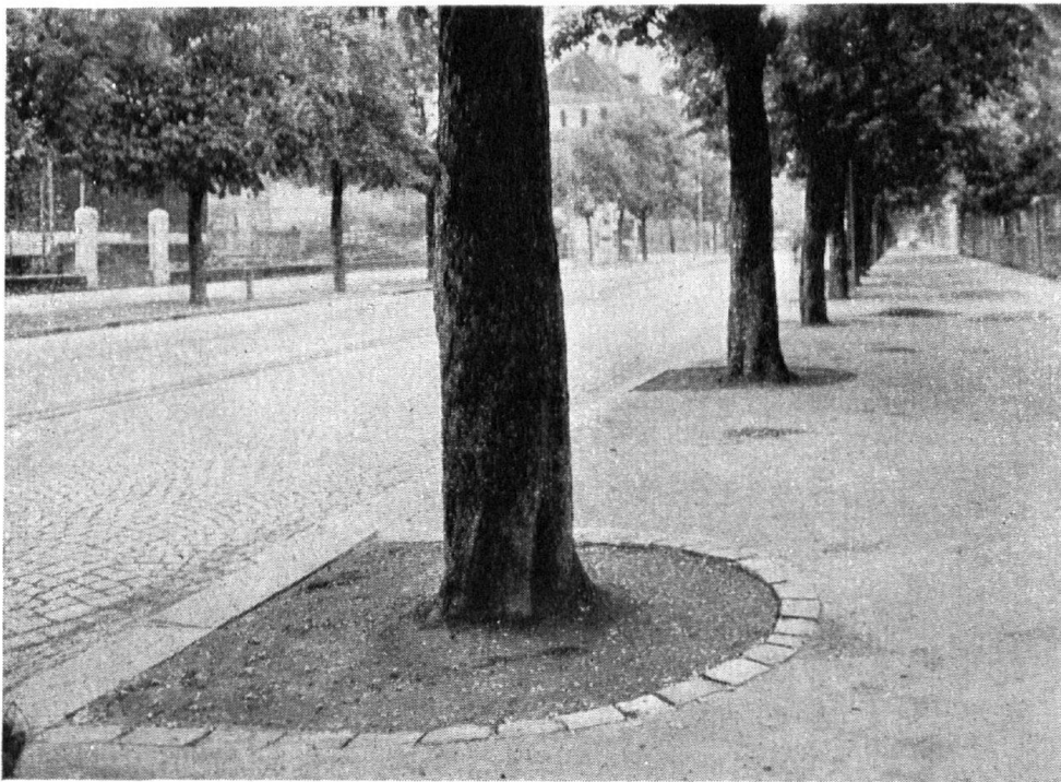
Offene Baumscheibe Thunstrasse, Bern