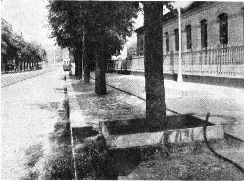
Giesskasten zur Bewässerung der Bäume