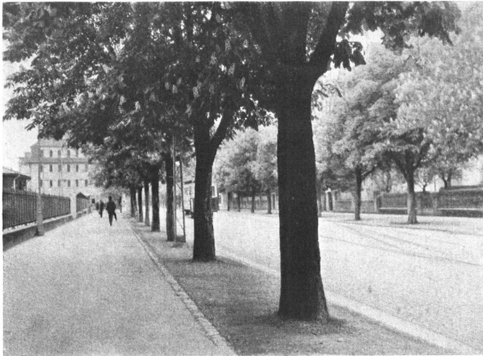
Offener Baumstreifen Thunstrasse, Bern