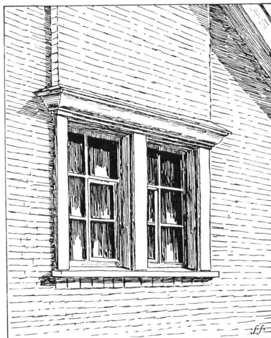
Gegenbeispiel: Wie heutzutage die Rückseitenfenster hässlich und langweilig gemacht werden.