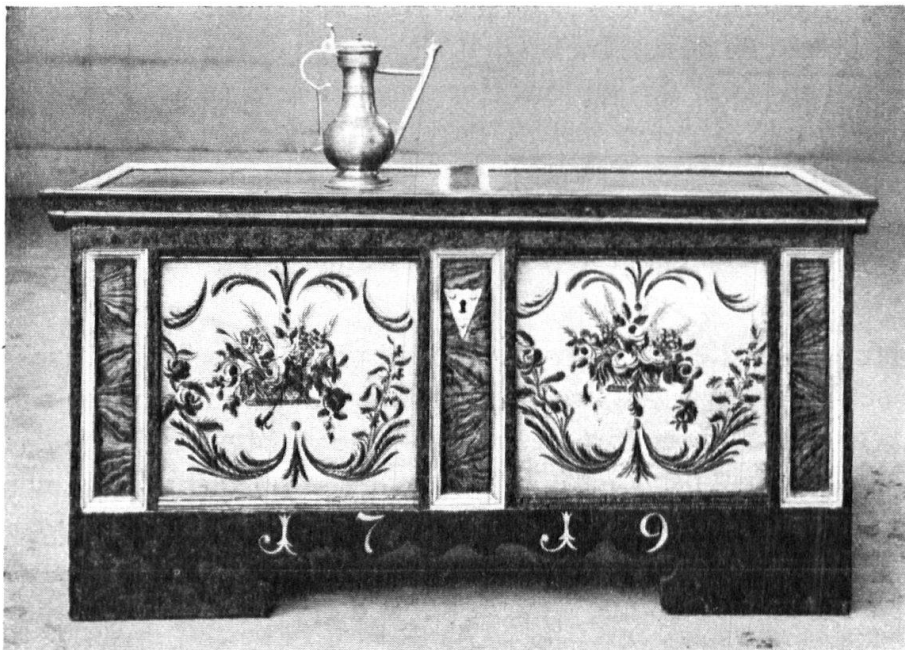
Emmentaler Truhe, von W. S. instand gesetzt. — Bahut peint bernois, restauré par notre peintre de village.