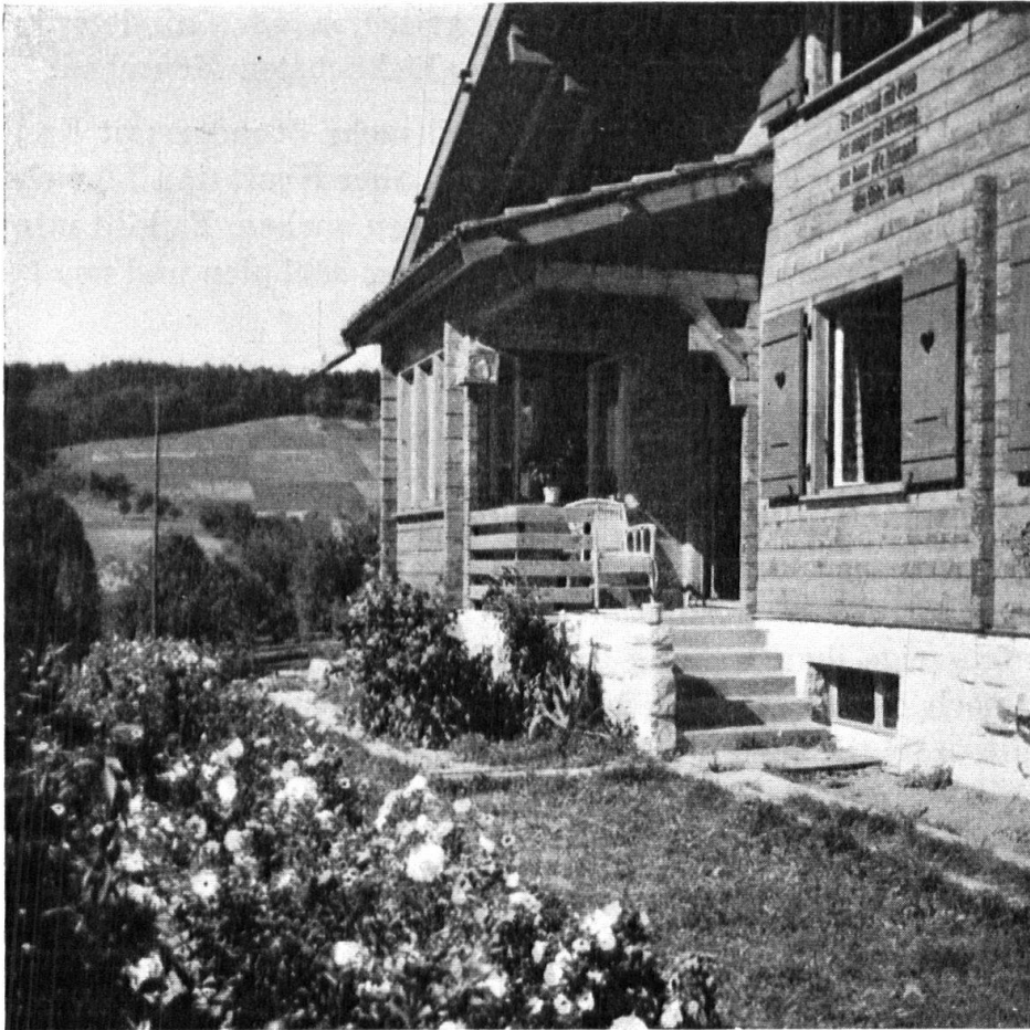
Wie sich W. S. eingehäuselt hat. — La maison de notre peintre de village.