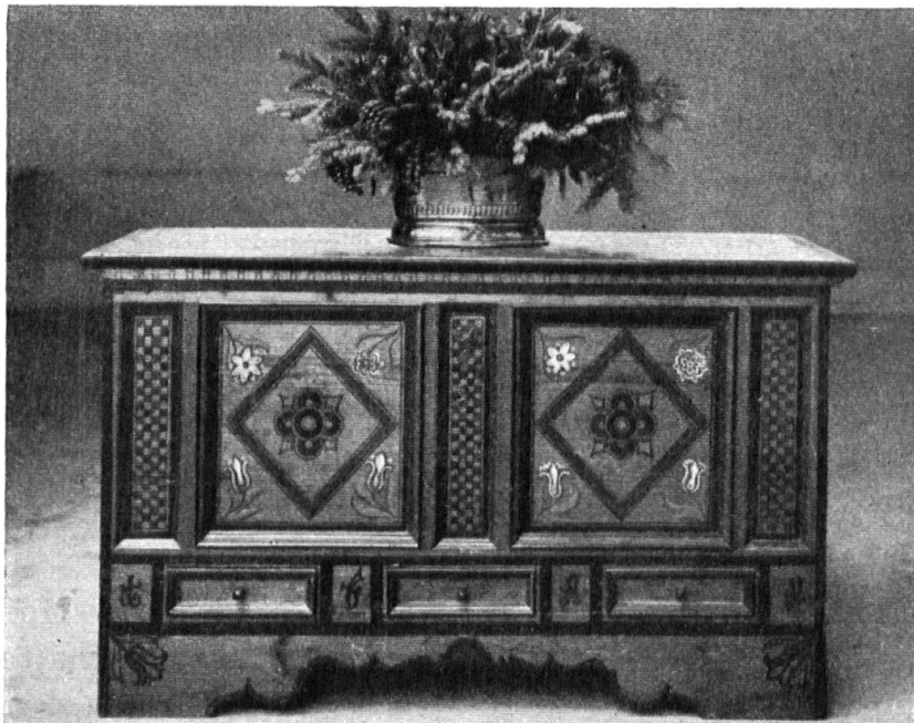
Truhe im Stil des 17. Jahrhunderts. — Bahut bernois dans le style du 17me siècle.