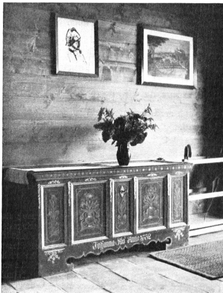
Wie die alte Truhe die Stube ziert. — Comment le bahut orne la chambre rustique.