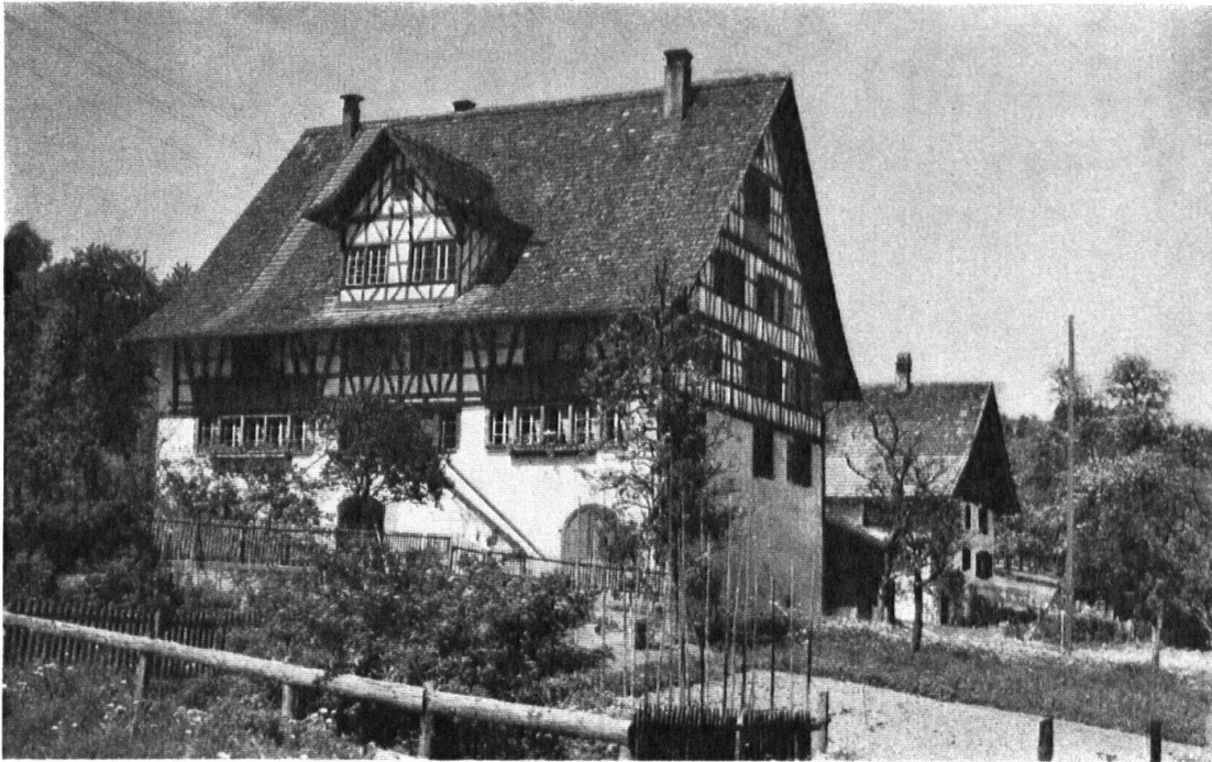
Haus Untermoosen in Wädenswil.