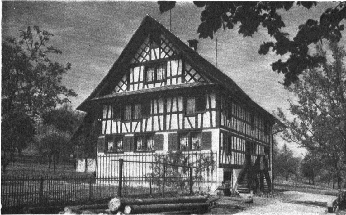
Haus „im Wendel“, Wädenswil.