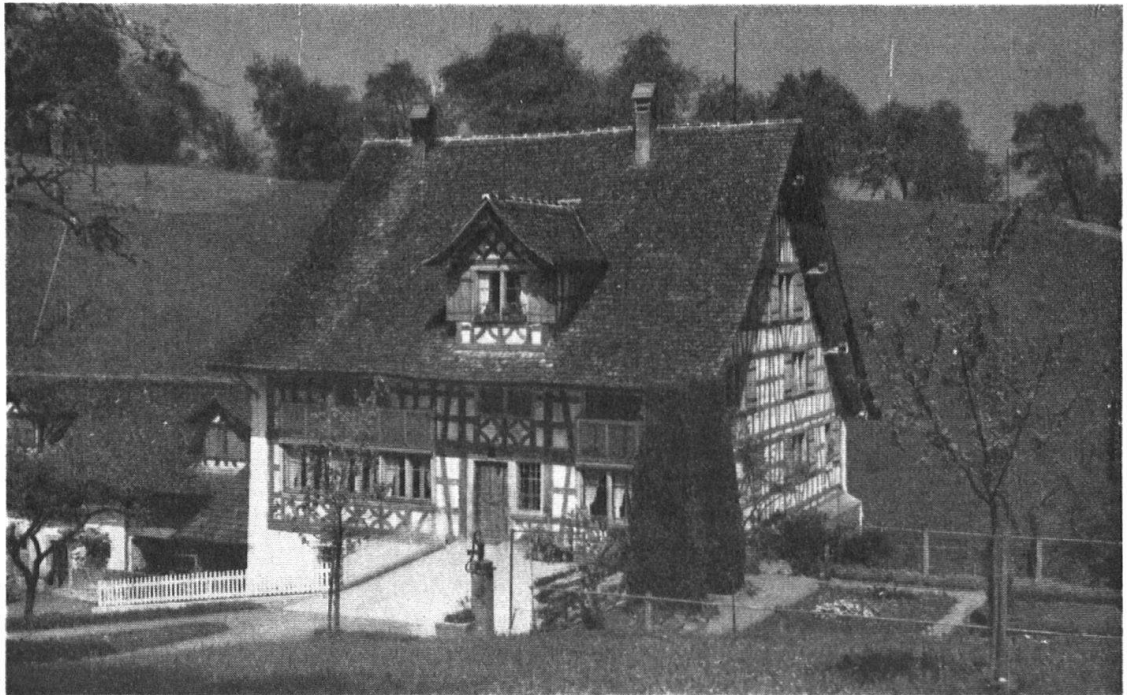
„Mühle“ auf Mühlestalden bei Schönenberg, Wädenswil.

Souvent il n'a que le mur tourné vers le soleil qui soit construit en pans de bois, peints en rouge; les autres murs sont massifs et montrent très peu de fenêtres.