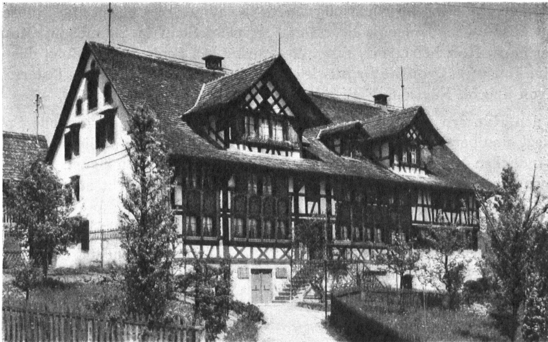
Haus auf Bühl in Wädenswil.

Le long du Lac de Zurich, on voit souvent deux maisons réunies sous le même toit. Tous les pignons sont tournés du côté du lac ce qui donne beaucoup d'unité et de caractère au paysage.