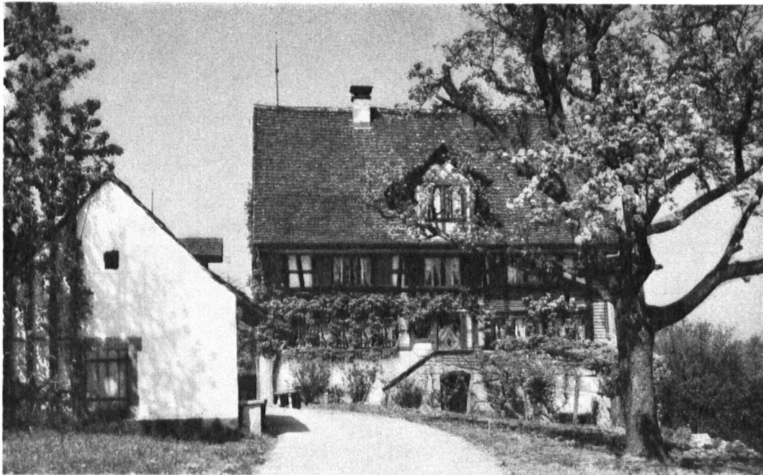
Haus „zur langen Stege“ in Wädenswil.

La maison du vigneron, comme on la trouve sur les bords du Lac de Zurich, est posée sur sa cave en forte maçonnerie dont les portes en plein cintre sont souvent ornées avec beaucoup de goût. Un perron nous amène au logement du 1er étage.