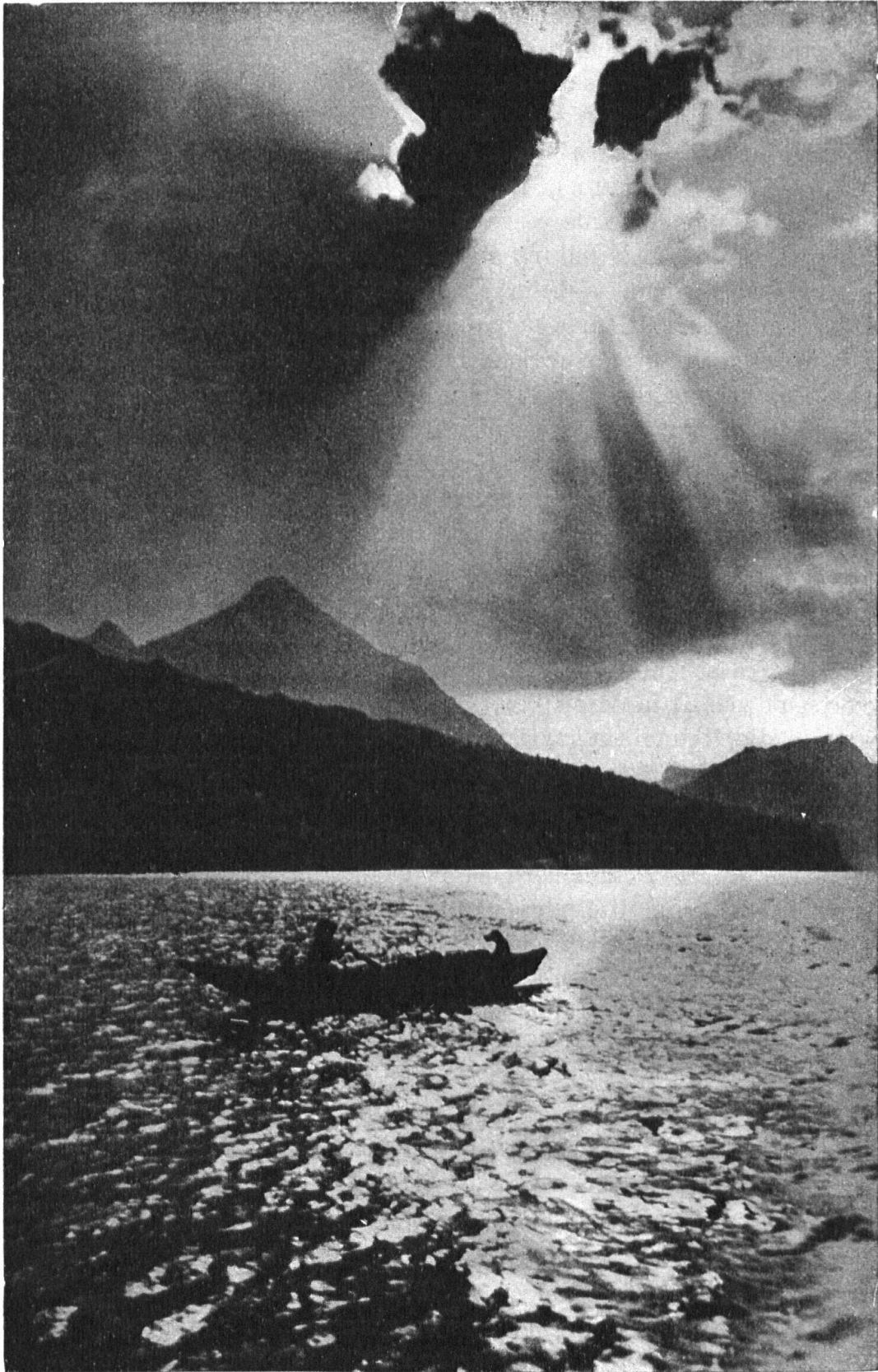
Vorsommerabend am Thunersee. — Lac de Thoune. Un coucher de soleil à la mi-juin.