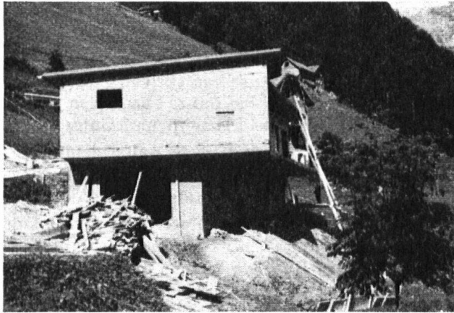
Ferienhaus. — Maison de vacances.