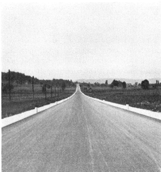
Vorzügliche Autostrasse, aber als Wanderweg unmöglich.

Der Vorstand der S. A. W. hat daher seine Aufmerksamkeit zunächst der Gestaltung des Wanderwegweisers zugewendet und einen einheitlichen Typus ge-