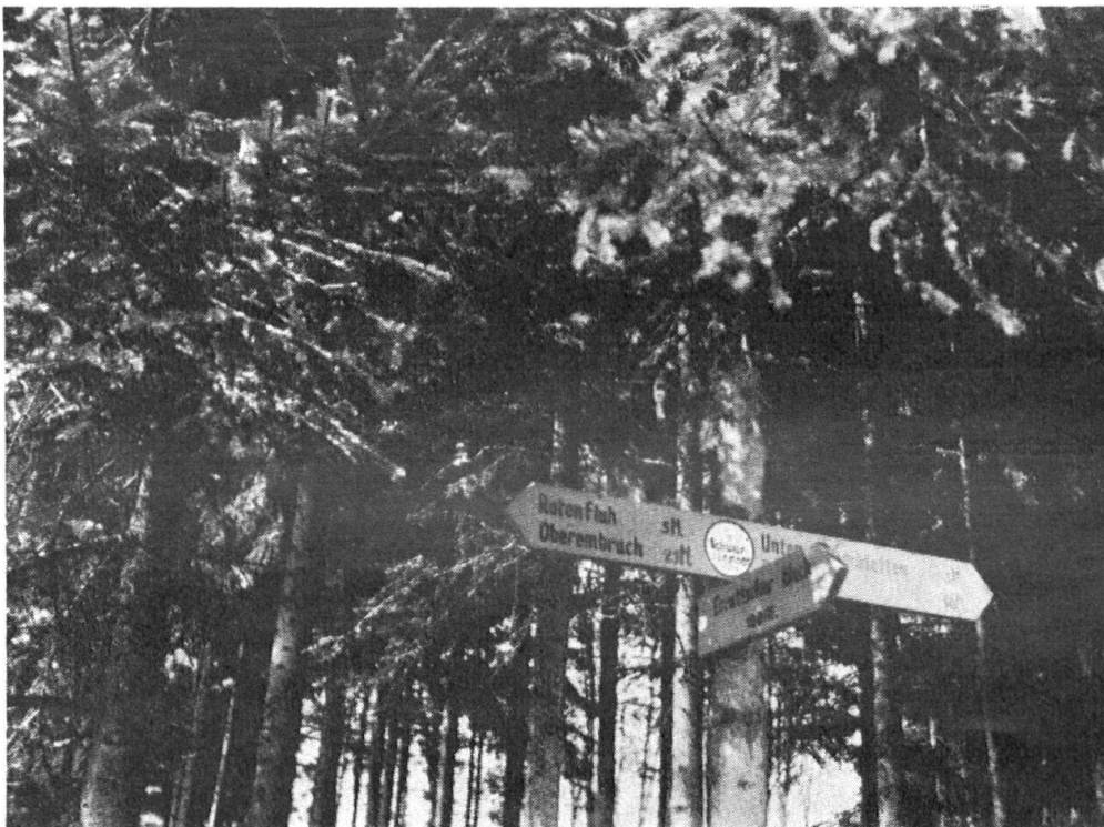
Aus dem Tannendämmer leuchtet der gelbe Wanderwegweiser.

Organisation auch sein mag (eigener Verband wie in Zürich, St. Gallen, Bern, Basel, oder Zusammenschluss der Verkehrsvereine wie in Solothurn und Aargau, Uebernahme der Aufgabe durch eine bestehende Organisation wie in Zug, im Tessin und Thurgau), immer kommt ihr die Aufgabe der zentralen Leitung, die Festlegung des planmässigen Routennetzes durch den ganzen Kanton, der Verkehr mit den eigenen Bezirken einerseits und der S. A. W. anderseits zu. Auf ganz verschiedene Art erfolgt auch die Beschaffung der Mittel , in der Hauptsache auf gemeinnützigem Wege, durch Einzel- und Kollektivmitglieder und freiwillige Zuwendungen; dann durch Beiträge der Gemeinden und der Verkehrsverbände. In den Kantonen Thurgau, Zug und Solothurn hilft der Staat mehr oder weniger