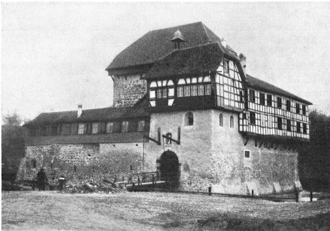
Das Schloss Hagenwil mit Tor und Zugbrücke von Süden.