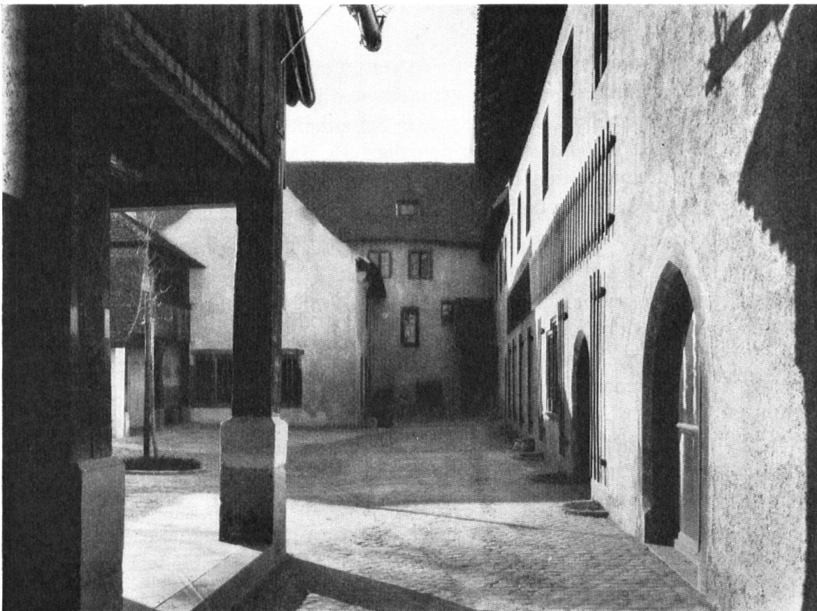
Hofansicht des Kleinen Klingental, als Münster- und Stadtmuseum neu eingerichtet.

Gegenwärtig wird das Pfarrhaus der St. Peterskirche instand gesetzt und verspricht sehr gut zu geraten. Ebenso der Hattstätterhof in Klein-Basel, der der katholischen Kirche gehört.