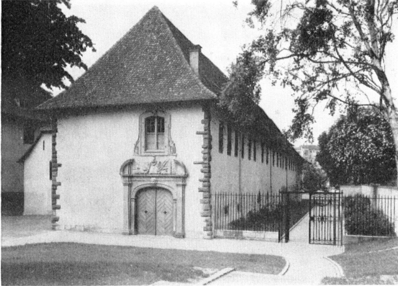
Rückseite des Kleinen Klingental mit dem Portal des neulich abgebrochenen Zeughauses.