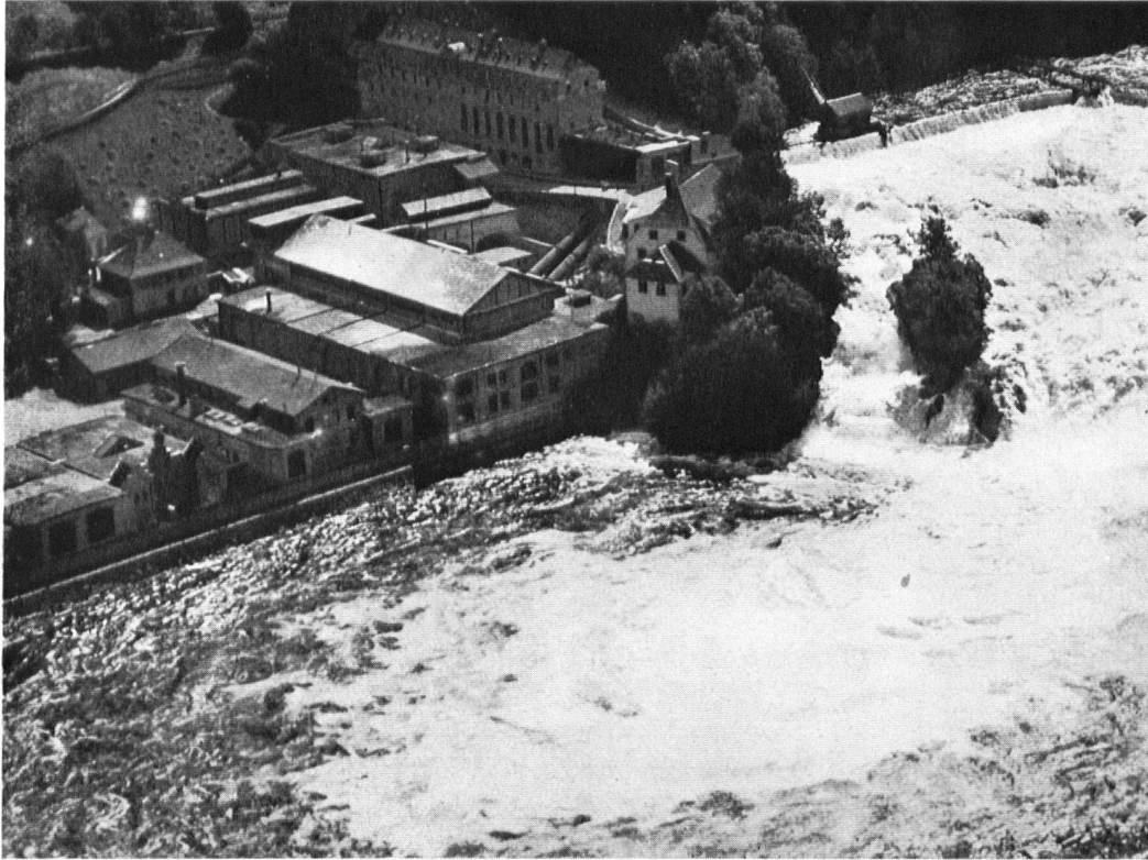
Hentiger Zustand: die häßlich wirkenden Industrieanlagen unmittelbar neben dem Rheinfall.

La chute du Rhin et les laideurs qui la souillent aujourd'hui.