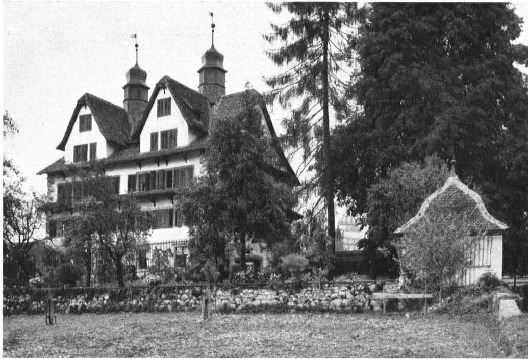
Das Ital-Redinghaus, erbaut um 1610. Reichstes und originellstes Schwyzer Herrenhaus. Rechts eines der „Schattebüsl“.

La maison d'Ital Reding, construite vers 1610, l'une des plus riches demeures patriciennes schwyzoises. A droite un pavillon d'été.