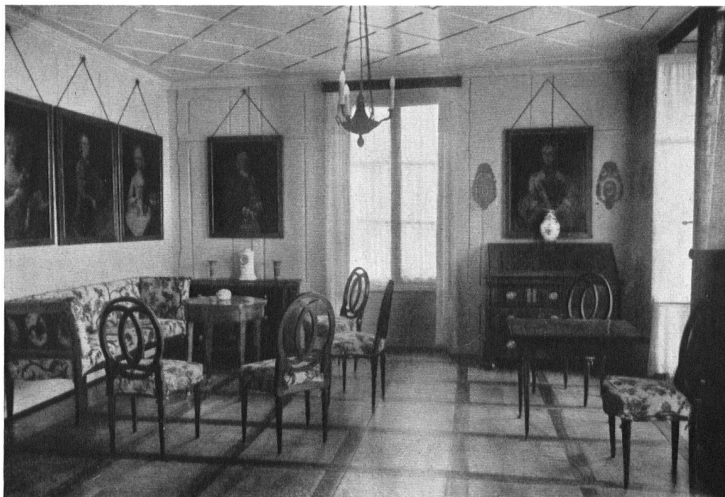
Der Gartensaal im „Brüel“. Die hell gestrichenen Wände und die Decke geben dem Raum heitere Wohnlichkeit.

La salon du « Brüel », donnant sur le jardin. Mobilier Louis XVI et portraits de famille.