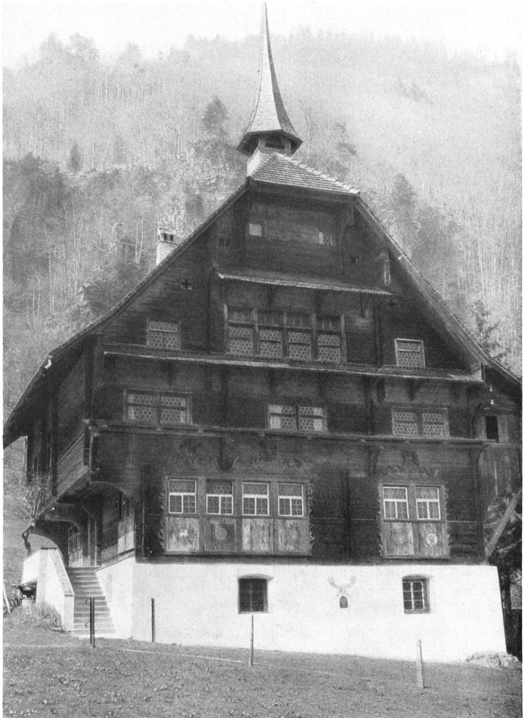
„Höchhuus“ in Wolfenschießen, herrschaftliches Holzhaus erbaut 1586 vom Nidwaldner Staatsmann Melchior Lussy.

La « Maison pointue » de Wolfenschiessen fut édifée pour le fameux homme d'Etat nidwaldien, Melchior Lussy (1529 à 1606).