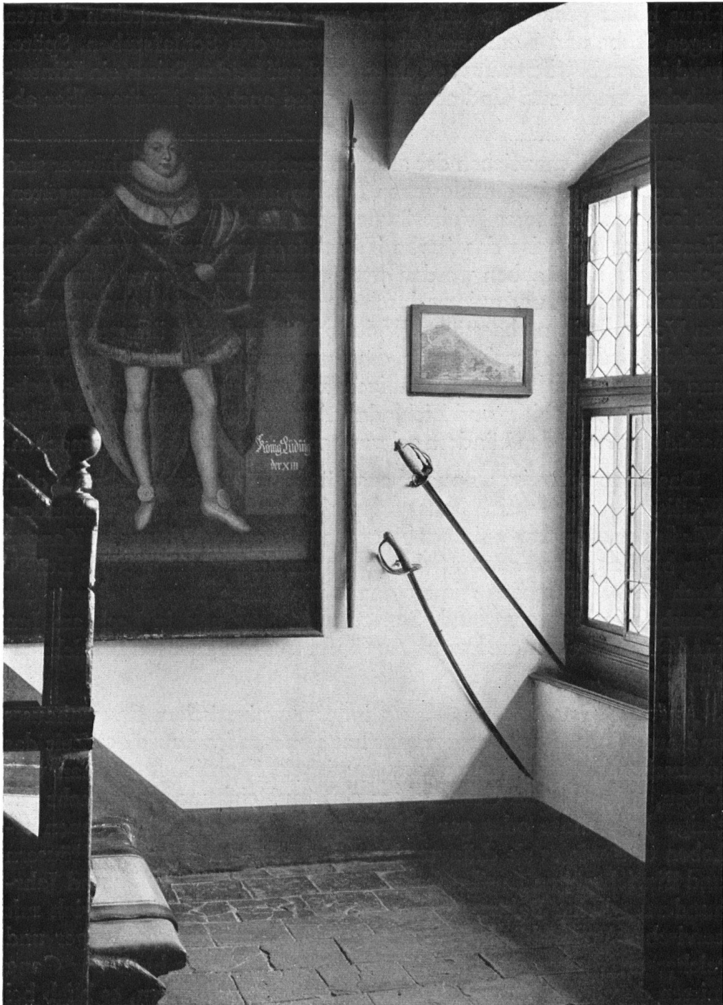
Treppenaufgang mit Bild König Ludwigs XIII. im Ital-Redinghaus zu Schwyz. Maison d'Ital Reding à Schwyz. La rampe d'escalier et le portrait du roi Louis XIII.