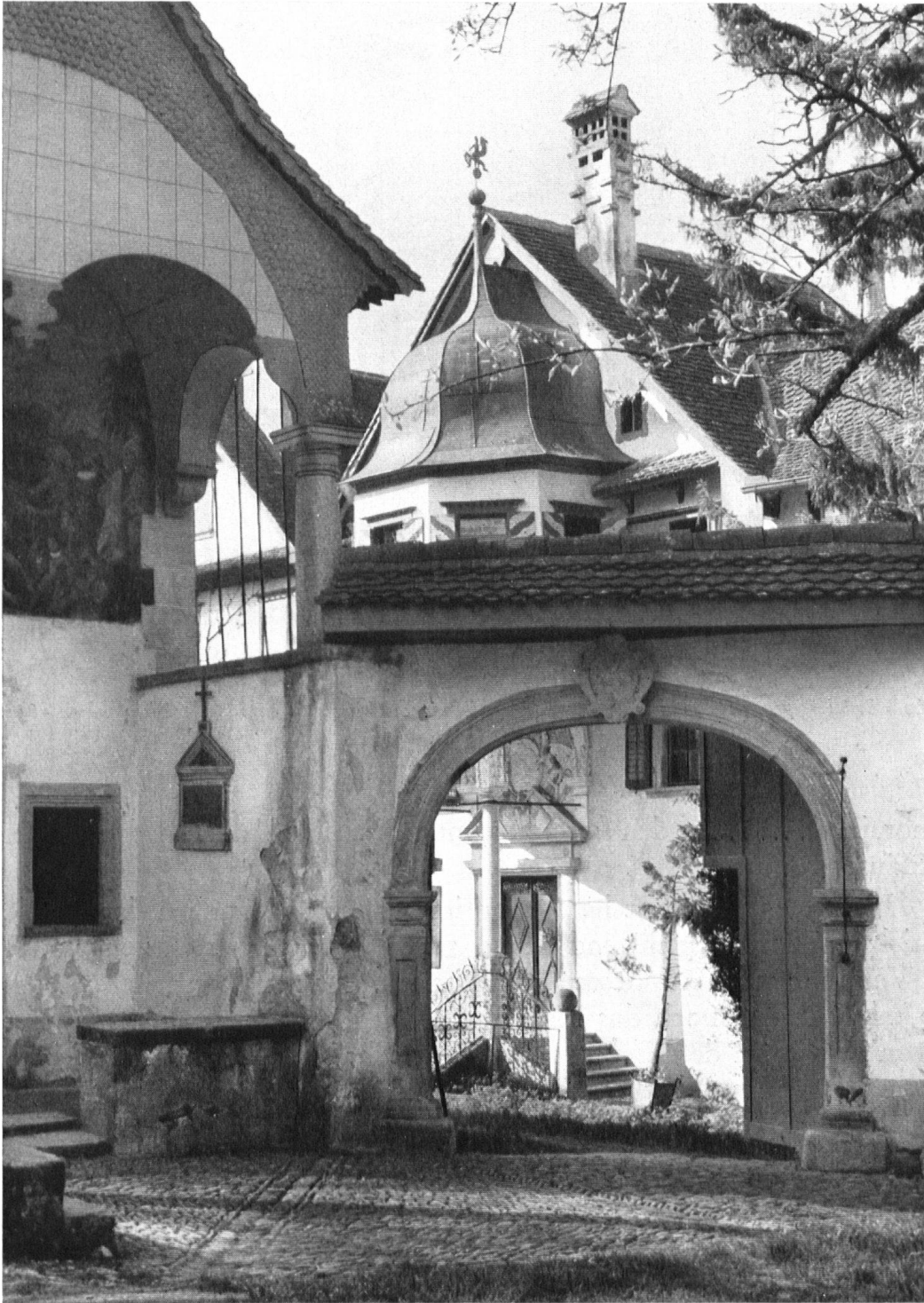
Der Herrnsitz zum „Immißfeld“. Blick in den Hof mit dem prunkvollen Eingang. Links die Hauskapelle St. Antonius von 1687.

« Immißfeld », demeure patricienne près de Schwyz. A gauche la chapelle de St-Antoine (1687).