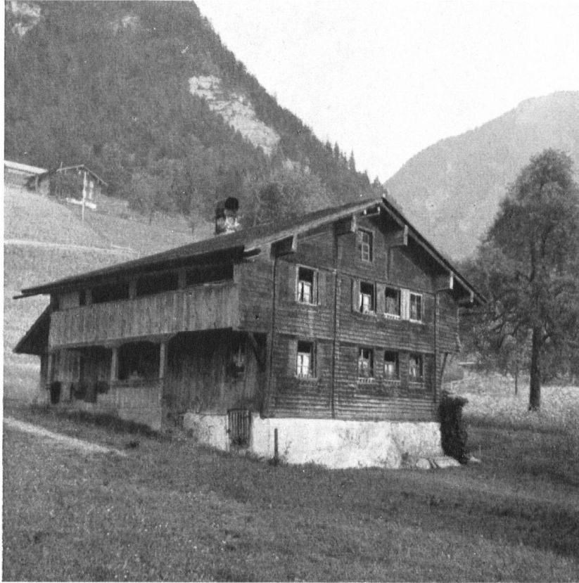
Bauernhaus in St. Niklausen (Obw.). Une maison paysanne à St. Niklausen (Obw.).