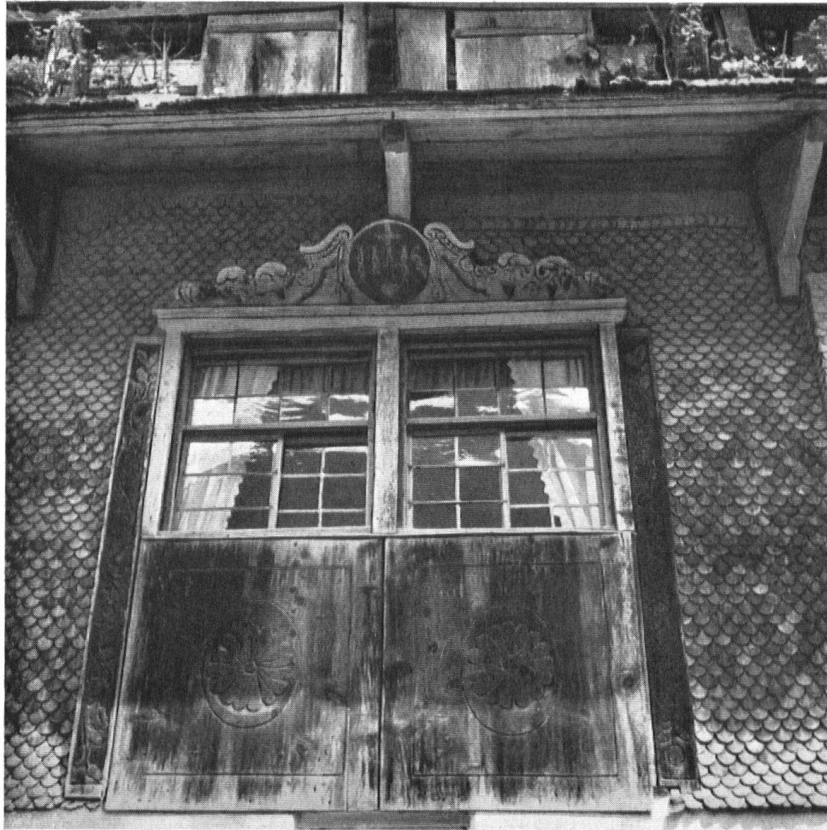
Fenster des Hauses nebenan. Ziebladen mit reich in Kerbschnitt verziertem Rahmenwerk, Ende XVIII. Jahrhundert.