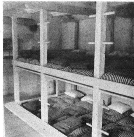
Heute eine ideale Herberge für die wandernde Jugend. Der aarg. und der schweiz. Heimatschutz haben den Umbau durch Beiträge gefördert. . . . est devenu le home idéal de la jeunesse itinérante, grâce à divers subsides venus, entre autres, du Heimatschutz suisse et argovien.