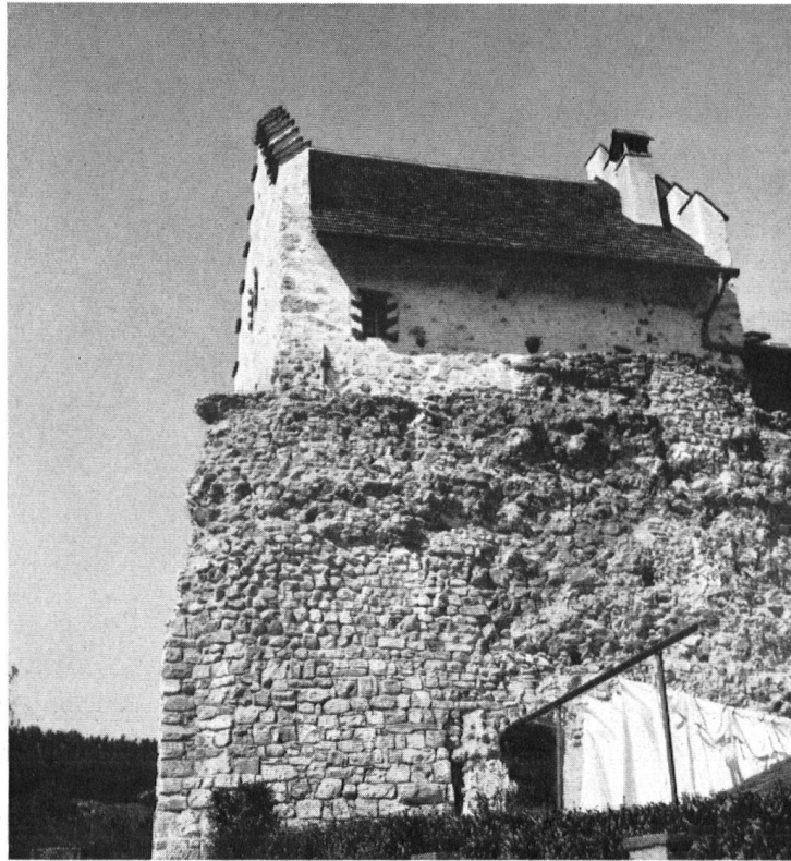
Mauerresten des spätrömischen Kastells Altenburg. Altenburg qui pose ses assises sur des murailles romaines . . .