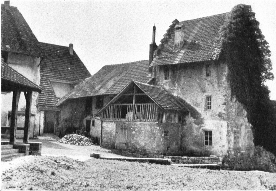
Das Schlößchen Altenburg an der Aare bei Brugg, romantisch verlottert, vom Abbruch bedroht. Le petit château d'Altenburg, au bord de l'Aar, près de Brougg, se ruinait lentement.