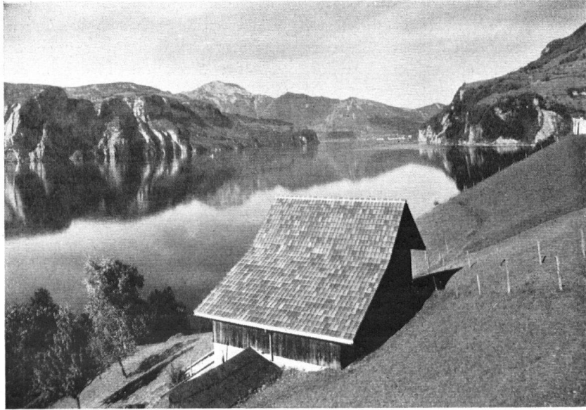
Der gleiche Gaden mit dem vom schweiz. Zieglervverband gestifteten neuen Ziegeldach.