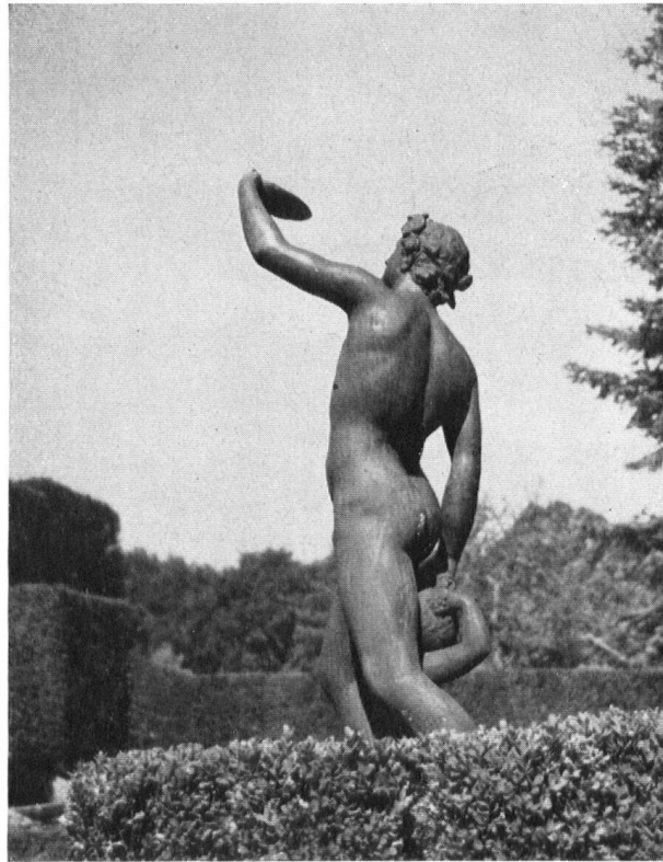
Französischer Bacchus im Rosengarten.

Le Bacchus du jardin des roses (bronze d'origine française).