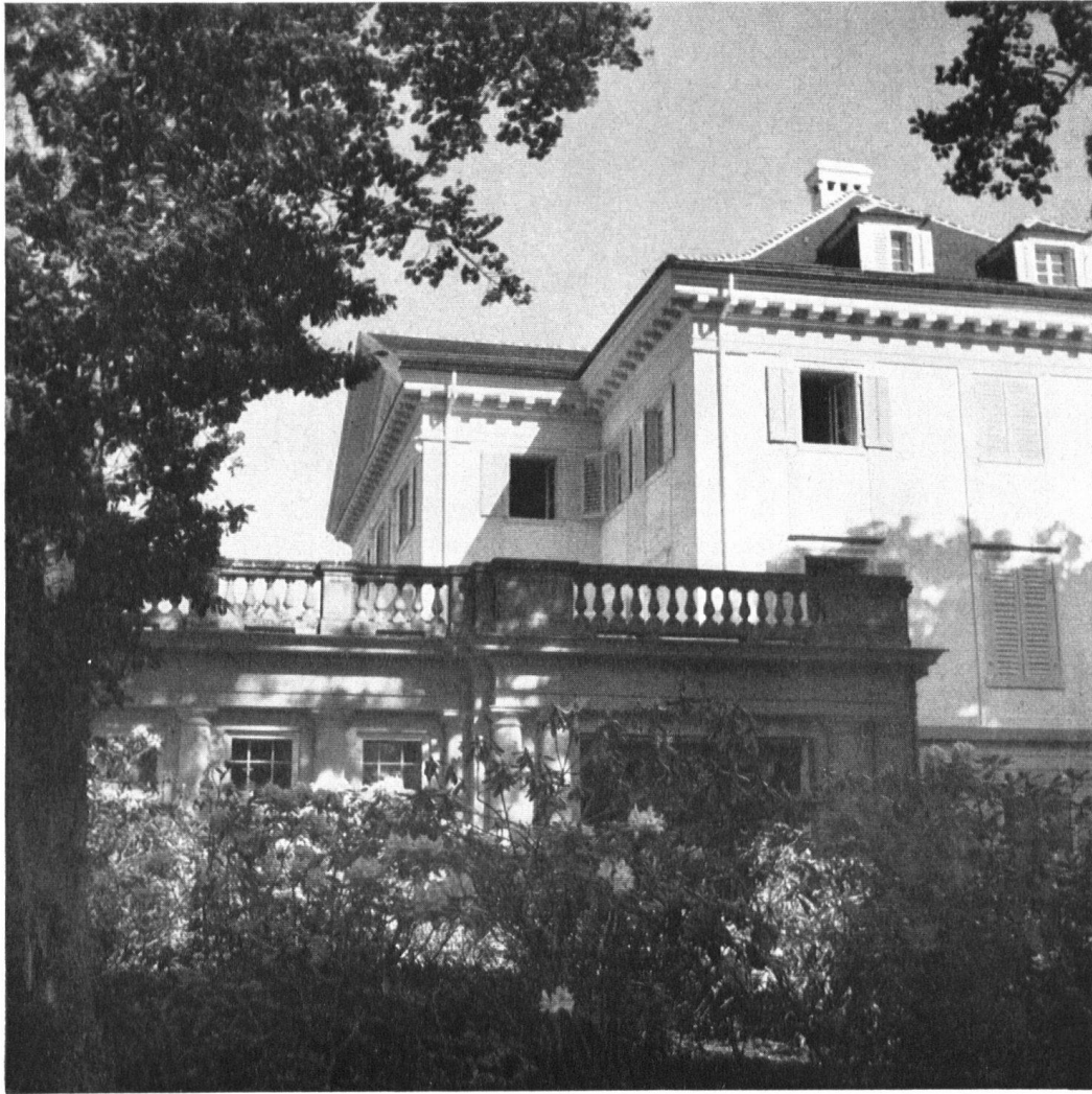
Rhododendren-Pflanzung vor dem Gartensalon.