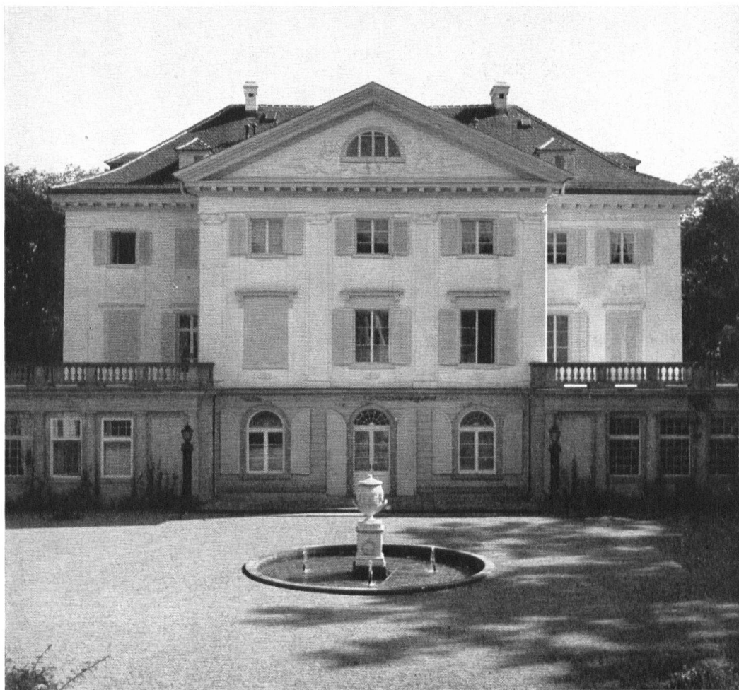
Schloß Eugensberg, Hofseite, Zufahrt. — Links nebenan Seeseite, vom Teich aus gesehen. Mont-Eugène, en Thurgovie. L'entrée du château. — A gauche, la façade orientée vers le lac.

Gütern des fürstlichen Geschwisterpaares entfaltetete sich ein reges Leben. Das Kommen und Gehen von hohen Herrschaften jener Zeit hielt die einfachen bäuerlichen Nachbarn in Salenstein, Mannenbach und Ermatingen in Atem. Noch heute erzählt man sich Anekdoten aus jenen bewegten Tagen am Untersee. Der Erbauer von Eugensberg konnte sich seines schönen Besitztums leider nicht lange erfreuen, denn er starb schon nach drei Jahren. Das Schloß mit dem dazu gehörigen Bauernland ging an seine zweite Tochter, die Prinzessin von Hohenzollern, über. Ihr folgten ein Herr von Kiesow, eine Gräfin Reichen-