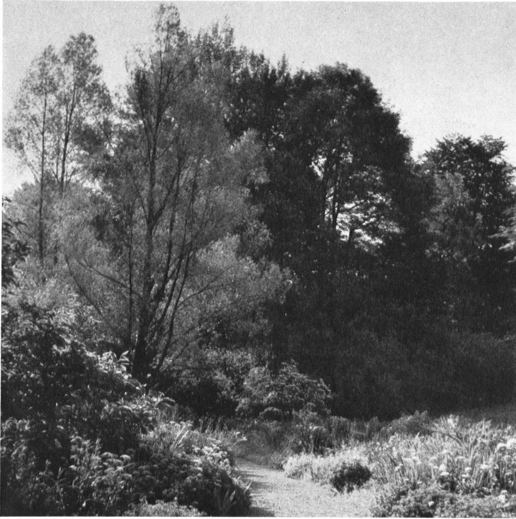
Im Schloßpark von Eugensberg.