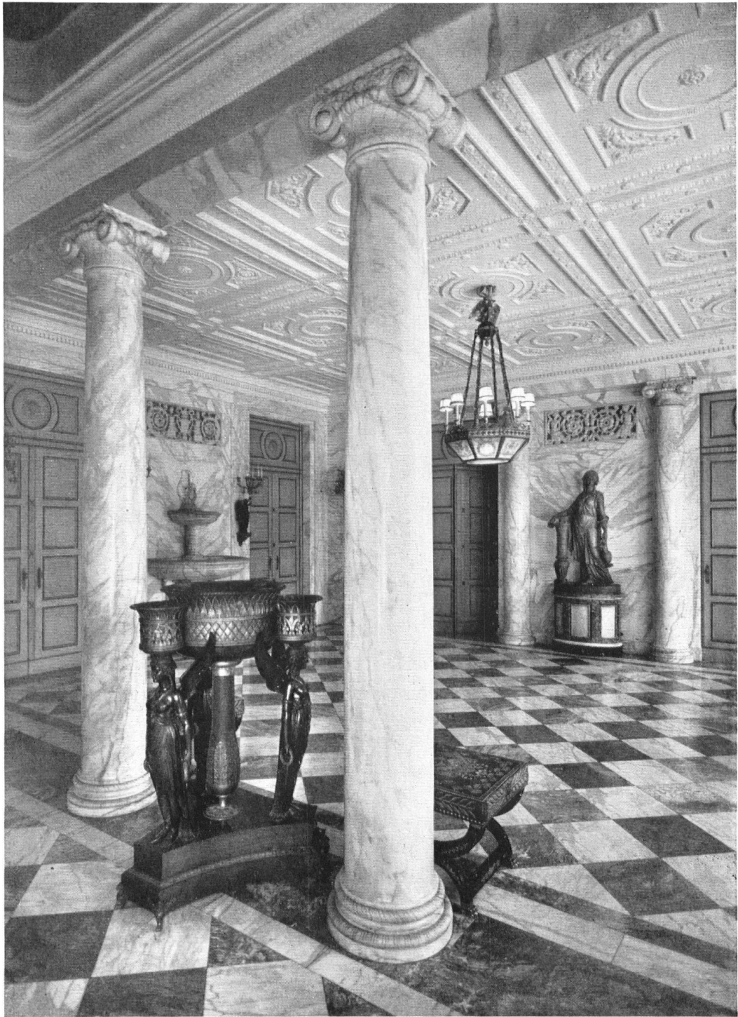
Schloß Eugensberg. Eingangshalle im Empirestil, von Architekt Rudolf Streiff †, Zürich, erbaut.

Hall d'entrée du château (architecte Rodolphe Streiff †, Zurich).