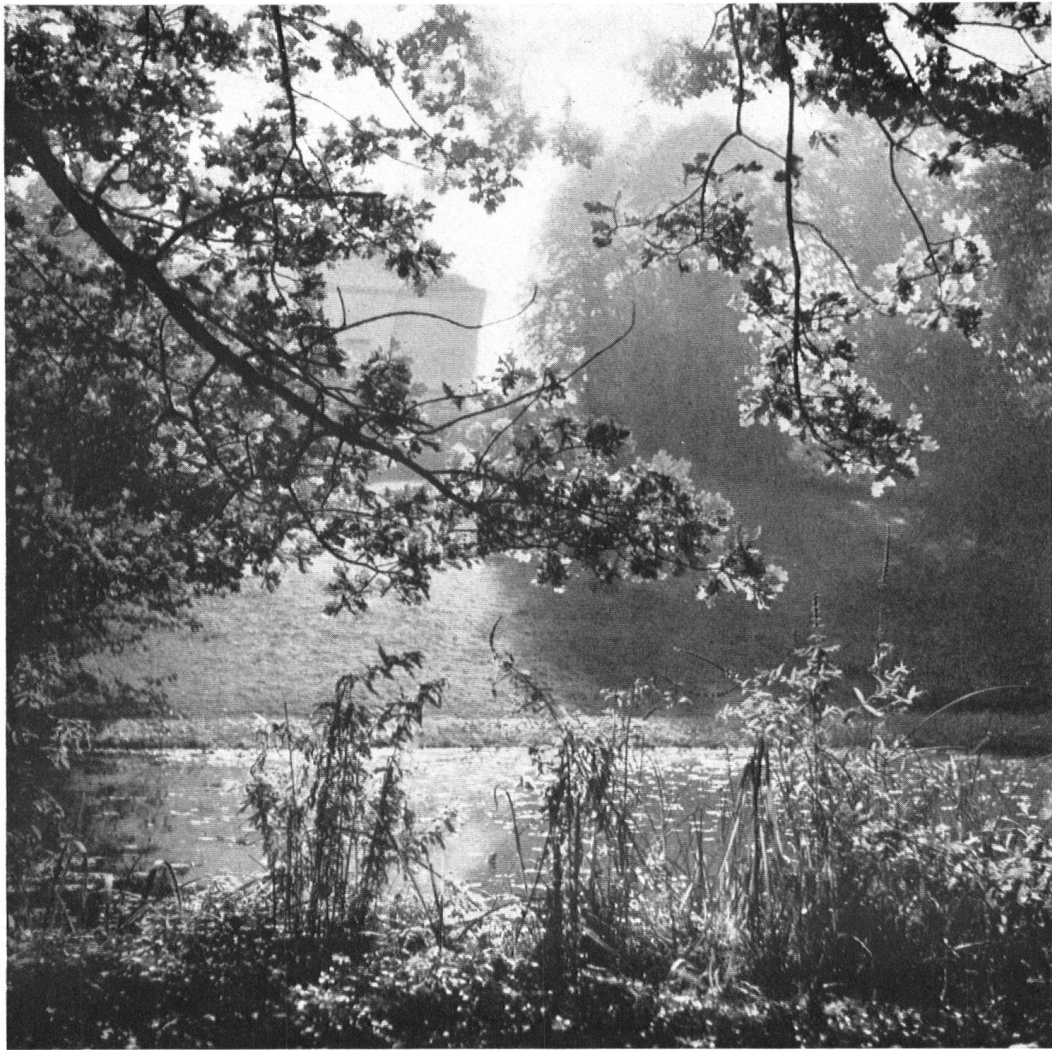
Schloß Eugensberg. Herbstmorgen am Seerosenteich. L'automne sur l'étang des Nénuphars.

in Besitz nahm und fürderhin betreuen wird. So ist es nun möglich geworden, daß viele Heimatfreunde den Sommer über dieses thurgauische Paradies besuchen und bewundern können. Wer sich für die reiche Kunst des Empire interessiert, wird sich stundenlang im Schlosse verweilen, das kostbare Mobiliar, die fürstlichen Teppiche, die hochwertigen Bilder alter und neuerer Meister, die reiche Porzellansammlung anschauen, daneben aber auch die reizvolle Aussicht von den Terrassen und Balkonen genießen. Der Naturfreund aber wird an der