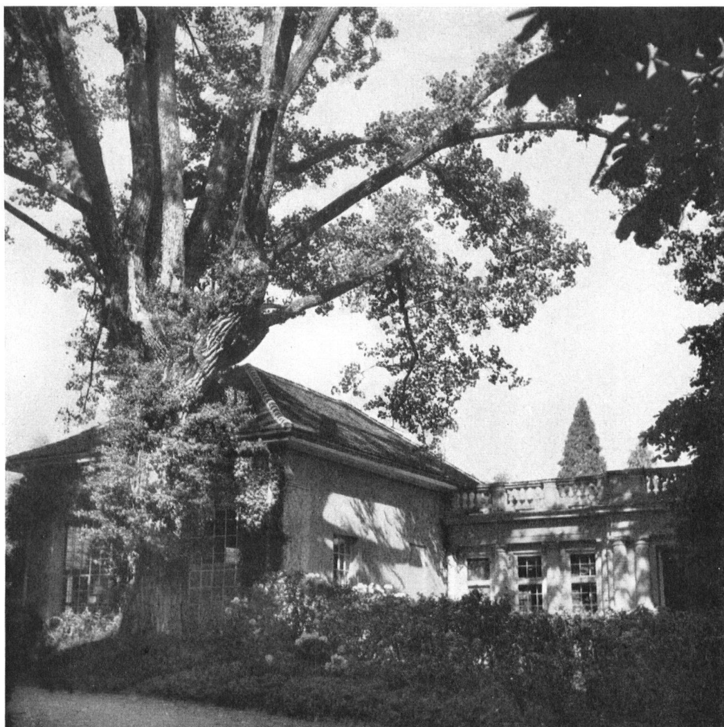
Schloß Eugensberg, Orangerie. L'orangerie.