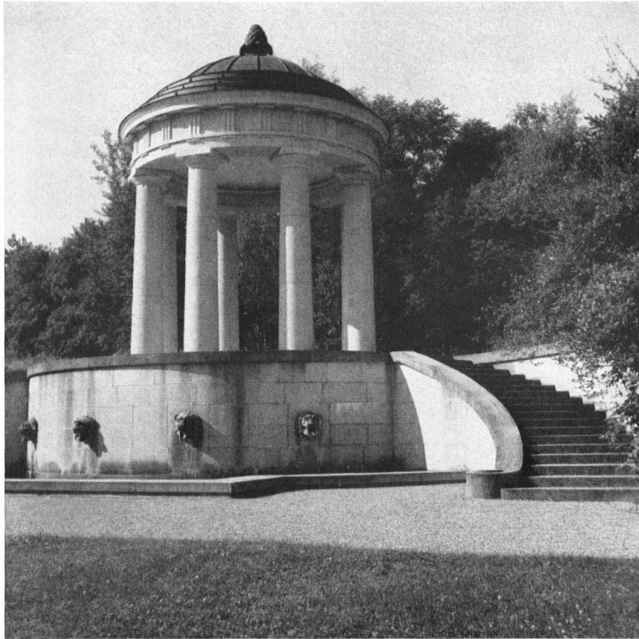
Schloß Eugensberg. Gloriette mit Wasserspeier. (Neubau von Geheimrat Bestelmeyer, München.) La gloriette (architecte Bestelmeyer, de Munich).

halten und wurde von Herrn Saurer zu einem einzigartigen Aussichtspunkt ausgestaltet. Freudig schweift hier der Blick über den Untersee, zur Reichenau hinüber und weit in deutsche Lande hinein. Die Mettnau samt Radolfszell und die fernen Hegauberge lassen den Zauber Scheffel'scher Romantik aufleuchten. Es ist ein wundervolles Verweilen dort oben auf der Höhe der Feste Sandegg, die als älteste thurgauische Burg ihre Bedeutung hatte in der Geschichte.