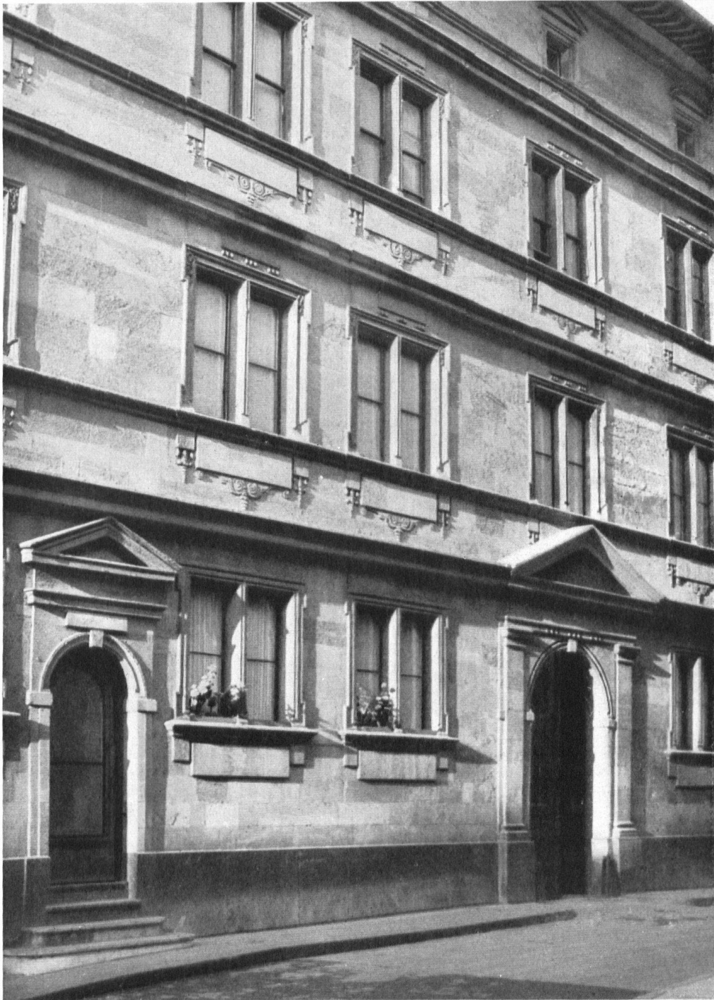
Un des palais du XVIIe siècle genevois, bâti pour François Turretini, en 1618, à la rue de l'Hôtel de Ville No 8 par l'architecte Faule Petitot qui était chargé simultanément de transformer l'Hôtel de Ville.

Das »Haus Turretini« (erbaut 1618 von Faule Petitot). Schönstes Beispiel einer bürgerlichen Residenz im Renaissancestil auf Genfer Boden.