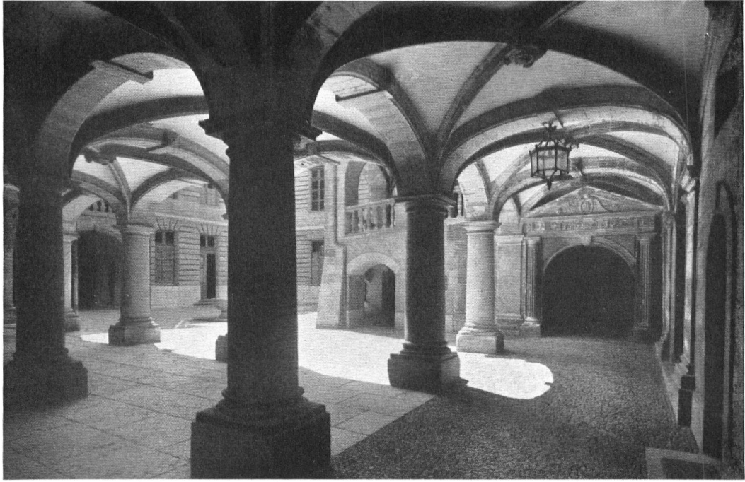
Le portique de l'Hôtel de Ville agrandi fut édifié en 1617 par l'architecte F. Petitot qui réserva, sans y toucher, la partie ancienne dont on aperçoit le porche d'entrée, d'une Renaissance toute française. — Säulenhalle des Stadthauses (1617). Im Hintergrund das Renaissance-Portal des alten, in den Erweiterungsbau von 1617 einbezogenen Rathauses.

Il y aura là tout un travail à entreprendre, qu'on a appelé le dénoyautage des cours. »