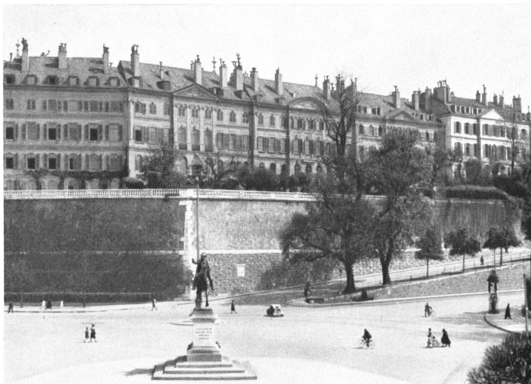
Façades des maisons Boissier et de Sellon (entrée rue des Granges 2-4-6), vues de la Place Neuve. Le mur d'enceinte sert d'assises à cet ensemble princier conçu par l'architecte J.-J. Dufour et construit par lui, entre 1720 et 1726.

Die unvergleichliche Reihe der Herrenhäuser auf der alten Ringmauer, erbaut 1720—1726 durch den Architekten J. J. Dufour. Auf dem Platz das Standbild von General Dufour.