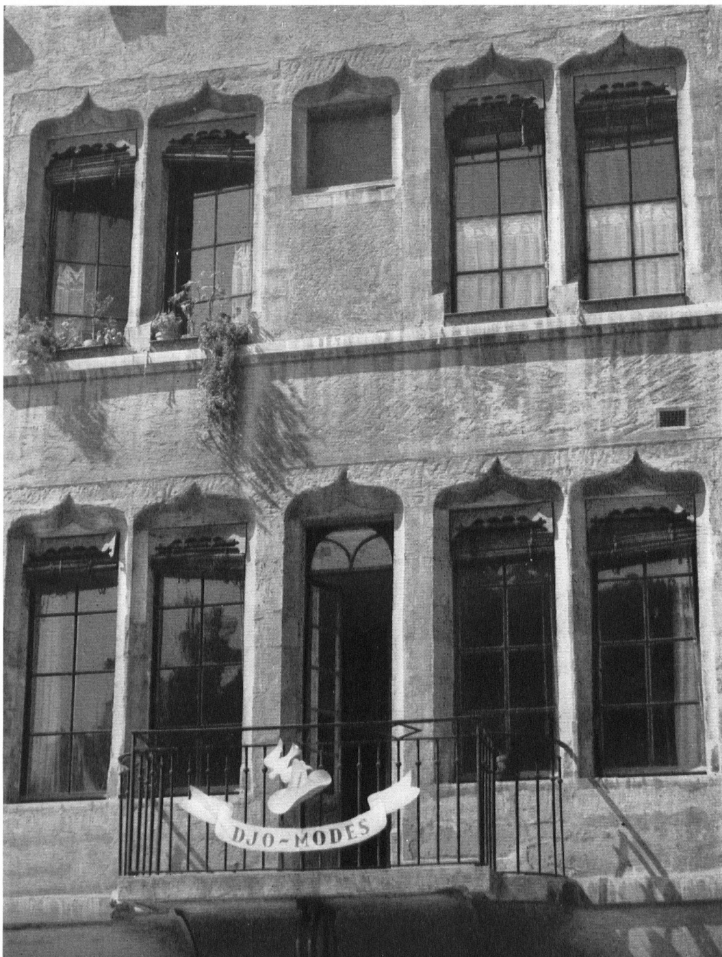
Le No 14 du Bourg-de-Four a été restauré. Les accolades, longtemps cachées par de faux encadrements, ont réapparu dans leur grâce première. Quant au balcon . . . le mal était fait. Gotische Fenster am »Bourg-de-Four«. Die falschen Fensterumrahmungen, die sie verdeckten, wurden unlängst beseitigt. Das halbvermauerte Fenster in der oberen Reihe ist leider geblieben und auch der später angesetzte Balkon mit dem zur Türe ausgebrochenen Mittelfenster waren »unberührbar«. Witzig das Firmazeichen der Hutmacherin.