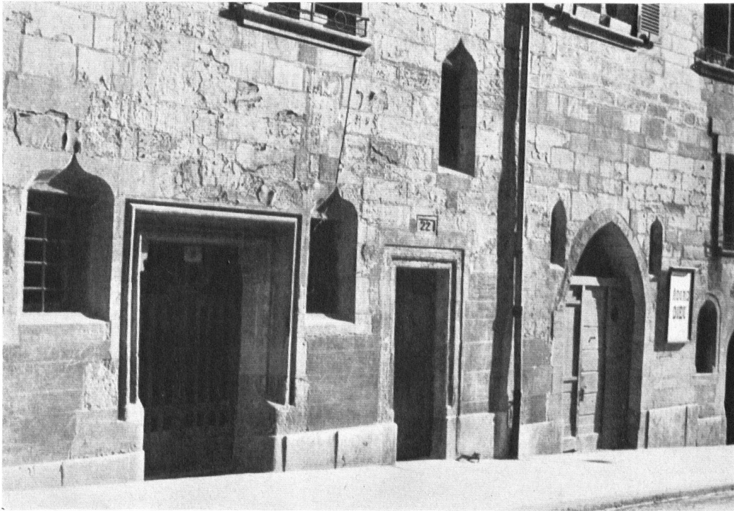
En haut: Entrée de l'ancien hôpital de la Trinité (rue St-Léger Nos 20 et 22) et porte de sa chapelle. Fondé en 1360 par Girod, de Moudon, maître maçon, et sa femme Béatrice, « pour les pauvres du Christ ». — En bas: Fenêtres gothiques à la Grand'rue No 6.

Oben: Eingang zum alten Dreifaltigkeits-Spital. Rechts das Portal der Hauskapelle. — Unten: Gotische Fenster an der Grand'Rue Nr. 6. Auch sie verdienen, daß man sie sorglicher pflegte.