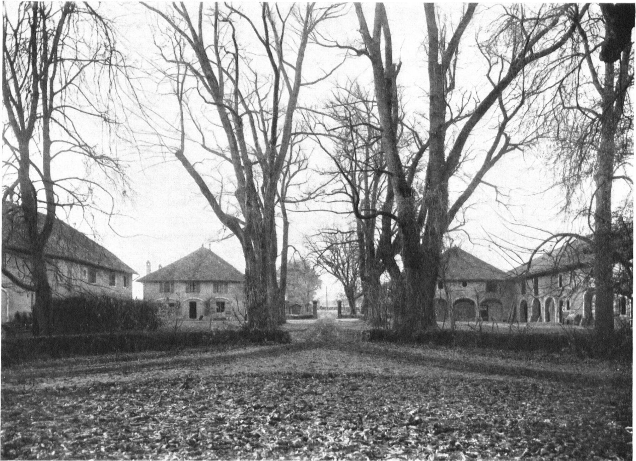
Les dépendances du domaine Saladin à Malagny. On admirera la disposition harmonieuse des bâtiments ruraux.

Wirtschaftsgebäude des Landgutes Saladin, heute de Pourtalès.