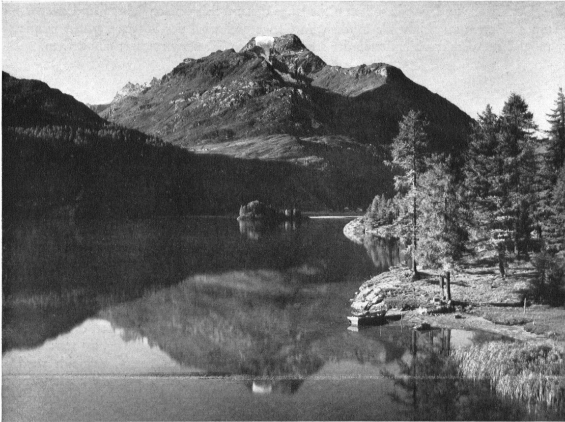
Naturufer an der Halbinsel Chasté. Im Hintergrund Piz La Margna.

Le Piz La Margna et les rives du Chasté, nom romanche qui se prononce « à la française », évoquant un château dont il reste les ruines.