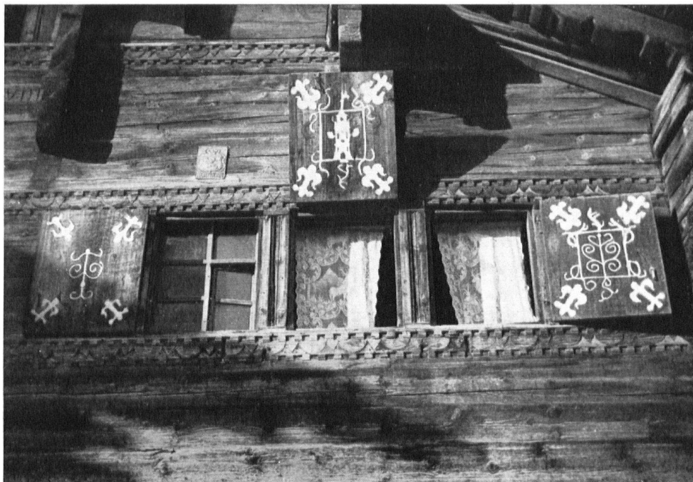
Das »Vrinerhaus« am Dorfplatz, eines der ältesten Häuser des Dorfes, das als Baudenkmal geschützt werden sollte. — Einzelheiten seiner Schauseite: Geschnitzte Balken, bemalte Fensterläden.