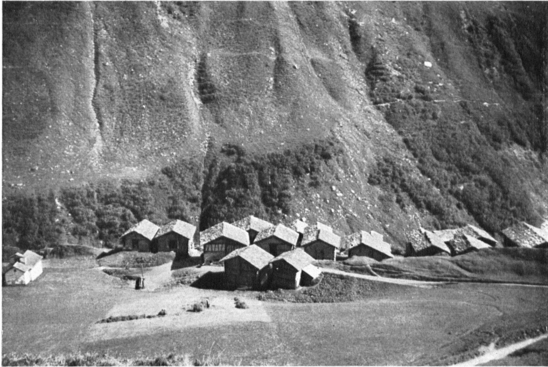
Der Maiensäß-Weiler Vanescha, der nur im Sommer bewohnt wird. Les mayens de Vanescha ne sont habités que l'été.