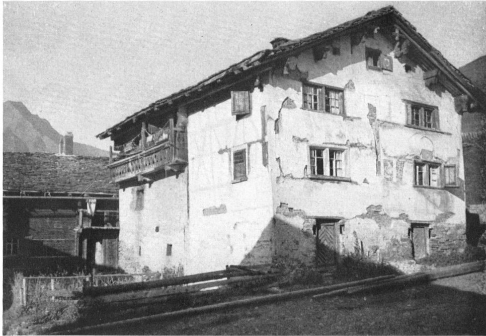
Vrin. Übertünchtes Riegelhaus. Schöne Verhältnisse, doch der bedenkliche Bauzustand läßt ahnen, daß der Eigentümer nicht wohl bestellt ist.

Maison de fort belle venue dont les murs crépis à la chaux méritent réfection.