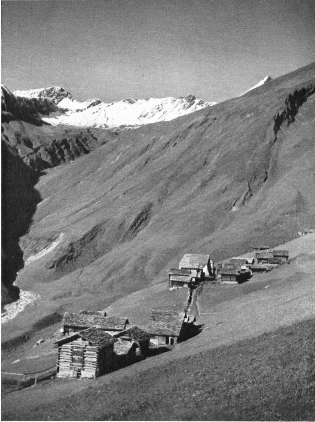
Puzatsch, der hinterste Hof in den Alpweiden, der auch früher nur im Sommer bezogen wurde. Puzatsch est le plus élevé des hameaux que gagnent les montagnards de Vrin pour y faire les foins.