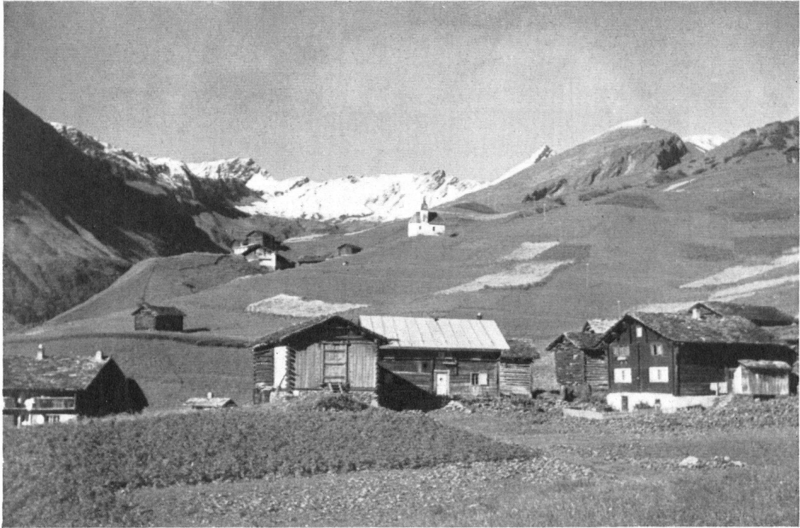
Die »Höfe« außerhalb des Hauptortes Vrin, die der Entvölkerung entgegen gehen. Hier der Hof Ligiartzun mit der Kapelle San Giusep.

Le hameau de Ligiartzun et sa chapelle de San Giusep fait partie de la paroisse de Vrin.