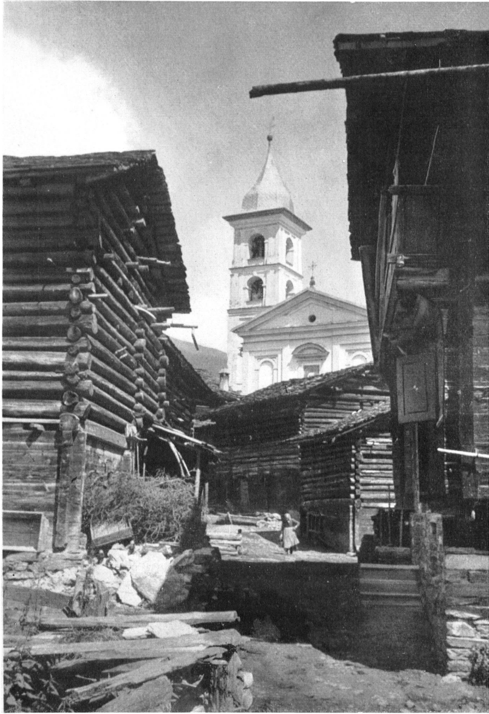
Vrin. Über den eng verschachtelten Häusern und Gaden stehen blendend weiß die barocke Fassade der Kirche und der schön gegliederte Turm. Ein packender Gegensatz. Dans l'enchevêtrement des granges noircies de Vrin, brille de tout son éclat un campanile étincelant.