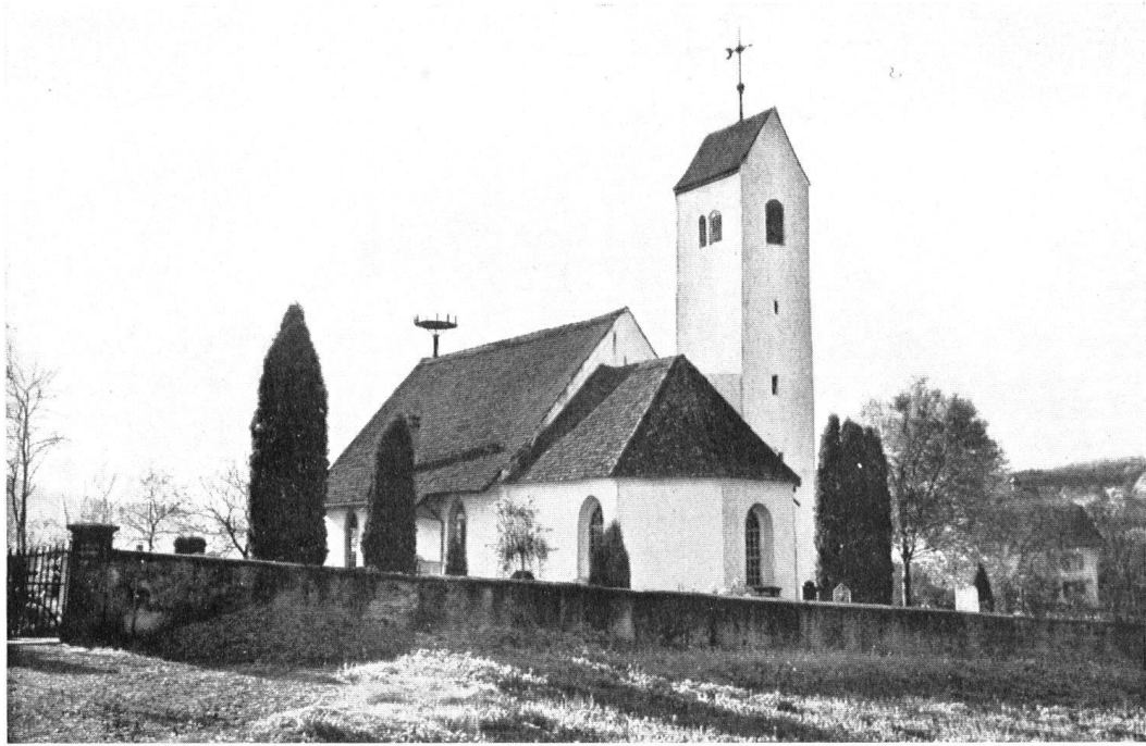
Die Kirche Möriken, wie sie sich heute darbietet.

Avec son clocher en « tranche de fromage » et son abside pentagonale, l'église de Möriken a conservé ses caractères autochtones.