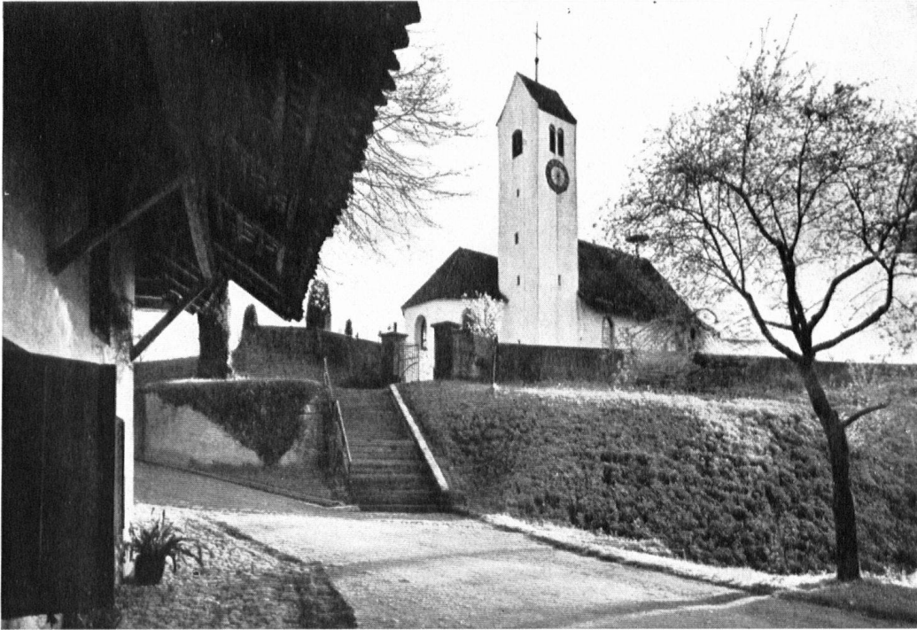
Die vom Abbruch bedrohte spätgotische Kirche im aargauischen Dorfe Möriken bei Wildegg. L'église gothique de Möriken, proche du château de Wildegg, sera-t-elle détruite?