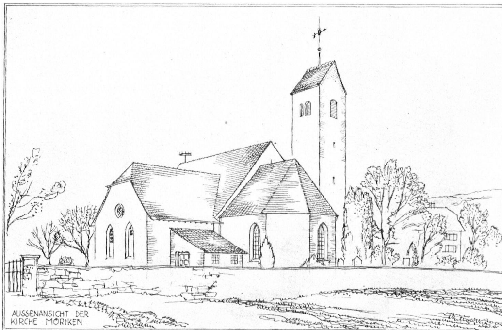
Die Kirche Möriken mit dem neuen Querschiff. Vorschlag unserer Planungsstelle.

Le projet d'agrandissement, établi par le bureau technique du Heimatschutz, permet à l'église de survivre.