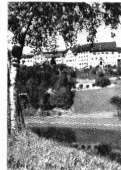
LICHTENSTEIG DAS ALTE FEISENSTÄDCHEN AN DER THUR

Seitdem im Kanton St. Gallen auch die Regionalplanung durchgeführt wird, konnte ein weiterer Schritt in der Richtung auf eine großzügige Ordnung der Verkehrs- und Bauzonen gemacht werden, an der der Heimatschutz besonders interessiert ist. Im Kontakt mit den zuständigen Fachbearbeitern war es uns möglich, städtebauliche und andere Fragen (z. B. Schutz des Reblandes am Montlingerberg vor Überbauung) in einem größeren Rahmen abzuklären. Wichtig ist, daß nun alle diese im Flusse befindlichen Bemühungen ihren rechtlichen Niederschlag erhalten. Wir haben die behördlichen Stellen schon wiederholt auf die Revision der kantonalen Bauordnung aufmerksam gemacht und drängen immer wieder auf die Schaffung eines Rahmengesetzes, in dem auch die Grundsätze der Regionalplanung und des Heimatschutzes verankert werden sollen. Zu unserer Freude können wir feststellen,