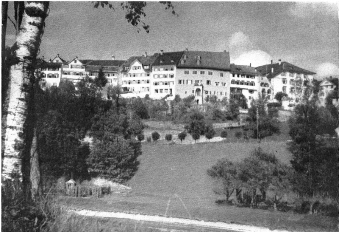
Lichtensteig im Toggenburg. Die malerische Südfront, wie sie sich bis 1942 darbot.

Du haut de son rocher, Lichtensteig domine la vallée de la Thur. Jusqu'en 1942, nulle faute grave n'en déparait l'auguste apparence . . . A tel point que la réclame utilise encore des vignettes périmées!