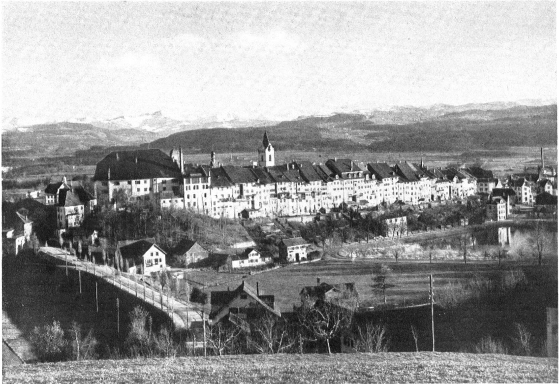
Die geschlossene Westfront des Städtchens Wil. Links vor dem „Hof“ das Gelände der alten Mühle, wo die Anlage einer Fabrik verhindert werden konnte.

Wil, au Nord-Ouest du canton de Saint-Gall, est aux avant-postes du Toggenbourg. — A gauche, sur le glacis qui descend du « Hof » au Vieux-Moulin, l'on a évité, de justesse, la construction d'une fabrique qui eût rompu l'unité architecturale des lieux.