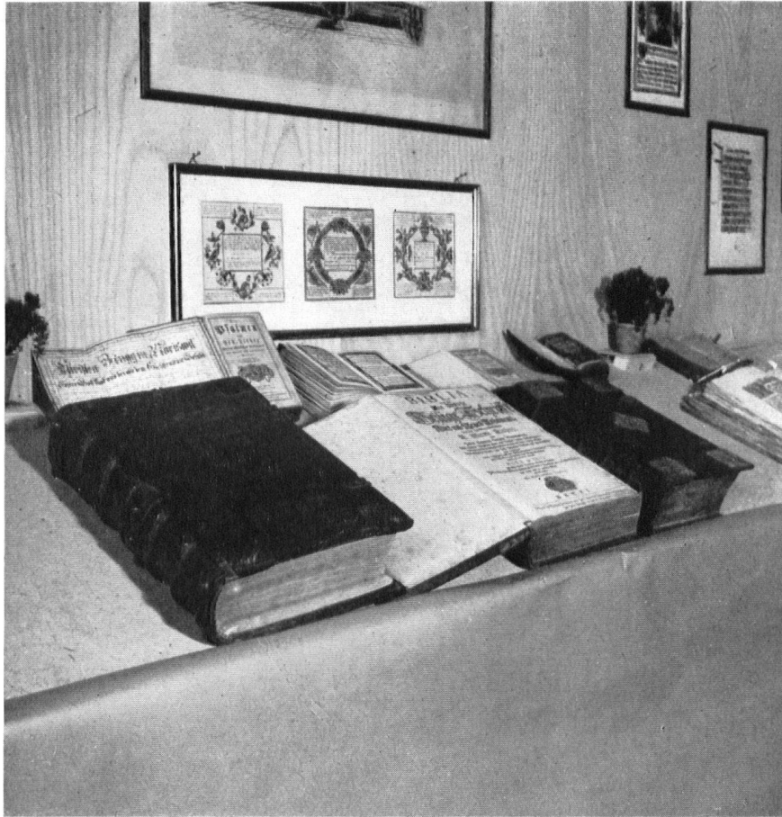
Dorfwoche in Schüpfen. Alte Bibeln, Psalmenbücher, Glückwünsche, die die Bauern zur Ausstellung brachten.

L'exposition de Schüpfen a mis en évidence les bibles antiques, magnifiquement reliées, les psautiers, les lettres de baptême ornées avec grâce.