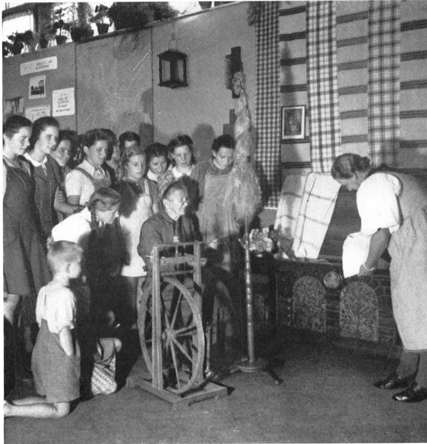
Dorfwoche in Schüpfen. Ein altes Müetti zeigt der Jugend, wie man ehedem den eigenen Flachs gesponnen hat. Eine junge Bäuerin führt die Erzeugnisse der wieder aufgenommenen Handweberei vor.

La Semaine du village à Schüpfen. — Une bonne maman montre aux jeunes générations comment, de son temps, se filait le chanvre semé dans les champs voisins et dont se tissaient ensuite les nappages somptueux.