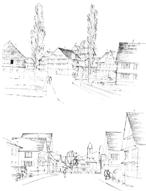
La reconstruction du village incendié de Stein (Toggenburg) d'après les plans généraux de notre bureau technique.

Der Wiederaufbau von Stein (Togg.) Nach dem großen Dorfbrand zu Stein im Toggenburg hat der Heimatschutz dem Baudepartement des Kantons St. Gallen seine Planungsstelle für den Wiederaufbau zur Verfügung gestellt. Sie wurde von diesem mit der Ausarbeitung des neuen Dorfplans und mit der Oberleitung über die Wiederaufbauarbeiten betraut. Die Projektierung und Bauleitung der einzelnen Gebäude liegt in den Händen freier Architekten, die von den einzelnen Grundeigentümern nach ihrer Auswahl beigezogen worden sind. Die einzelnen Projekte wurden von diesen auf der Grundlage des generellen Bebauungsplanes und der Ansichtsskizzen der Planungsstelle nach Maßgabe des Bauprogramms der einzelnen Bauherren ausgearbeitet. Das kantonale Hochbauamt (Kantonsbaumeister Breyer) und der Berichtende hatten die Projekte zu genehmigen. Im Rahmen einer guten kollegialen Zusammenarbeit entstanden die verschiedenen Bauten, die im wesentlichen dem bodenständigen Toggenburger Haus verpflichtet, doch andererseits die persönliche Note ihrer Erbauer nicht verleugnen. Es ist damit heute in Stein ein neuer Dorfkern im Rohbau fertig, der in einer schönen Ausgewogenheit Rücksicht auf das Gemeinsame und Individuelles in sich schließt, und der, wenn einst alles fertiggestellt ist, ein Zeitdokument bilden wird, dessen wir uns nicht zu schämen brauchen. Er wird die erfreuliche Rechtfertigung sein für die aufgeschlossene Spendefreudigkeit, die nach dem Brande sich im ganzen Schweizervolk bewährt hatte.