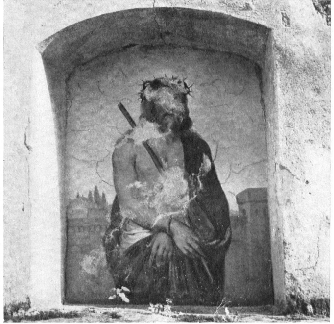
Camposanto in Soazza. Christus mit der Dornenkrone. Le Camposanto de Soazza. Le couronnement d'épines. Camposanto a Soazza. Cristo con la corona di spine.