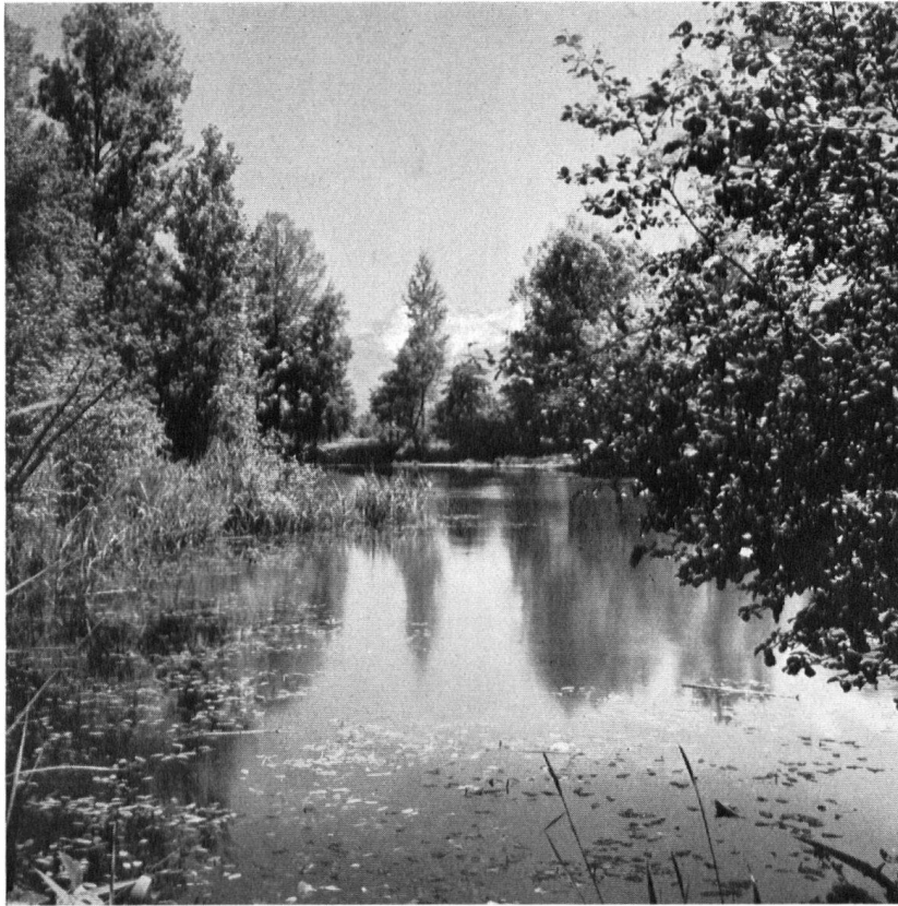
Der Alllauf der Rhone unweit von Le Bouveret. Ein herrlicher, stiller Heimatwinkel, zugleich eine botanische und faunistische Fundgrube. Kein Wunder, daß die Vogelfreunde sich für diese Gegend wehren. L'ancien delta du fleuve est une sorte de paradis. On comprend que les amis de la faune et de la flore s'émeuvent pour en conserver l'intégrité.

dures délicates et de leurs fins feuillages, que chênes noueux, saules aux frêles ramures jaillissant de troncs trapus, acacias odorants, colonnes claires des bouleaux dont la couronne légère et tendrement grise offre des sous-bois si lumineux, peupliers au jet puissant, trembles dont les feuilles bruissantes semblent sans relâche chuchoter les mêmes paroles.