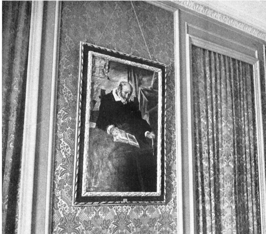
Die Villa auf den Inseln von Brissago als Kulturzentrum: Bald nach der Eröffnung begann dort die erste Kunstausstellung, die den Werken des bedeutenden Asconeser Barockmalers Giovanni Serodine gewidmet ist.

nächsten Bambusgehölz ließ man sich gerne aufhalten. Dienende Geister boten den Ehrentrunk des Staatsrates des Kantons Tessin an, ein Labsal, mit dem man sich die dürstende Kehle freudig kühlte. Dann aber schwärmte man aus auf allen Wegen, wandelte im Schatten der Palmen und Eukalyptusbäume, roch an Rosen und goldenem Ginster, ärgerte sich über die Lausbuben, die mit ihren Taschenmessern bereits ihre einfältigen Namen in die fleischigen Blätter der Riesenagaven gekritzelt hatten, hörte von der Bernerin, die einen Rhododendronstrauch plünderte und seelenruhig erklärte, für einen Franken Eintritt werde man sich wohl einen Blumenstrauß mit nach Hause nehmen dürfen, und kam dann unter den beiden offenen Säulenhallen zum Mittagmahl zusammen. Der Berichterstatter hatte es selber bestellt, und darum darf er wohl in Freiheit sagen, daß er es sich etwas mehr im Stil des Hauses vorgestellt hatte. Immerhin, man ist satt geworden, und was fehlte, aß und trank man mit den Augen vom reich gedeckten Tische der Natur, die ihre köstlichsten Bilder von allen Seiten zum Genusse anbot.