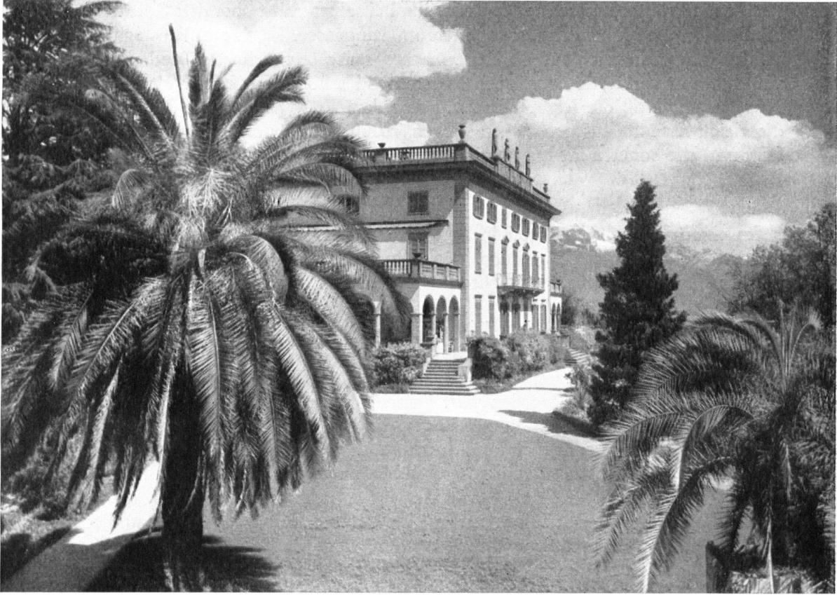
Das Herrenhaus auf den Inseln von Brissago, wo die Hauptversammlung des Heimatschutzes tagte. Es erinnert an das größte Talerwerk des Heimat- und Naturschutzes in den Jahren 1949/50. Einzelheiten siehe im letzten Heft dieser Zeitschrift.