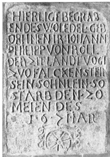
Antonius-Kapelle in Balsthal. Die instandgestellte Grabplatte des Knäbleins Johann Philipp von Roll aus dem Jahre 1671.

Dans la chapelle de Balsthal, une dalle funéraire de 1671 conserve la mémoire d'un petit garçon, Jean-Philippe de Roll.