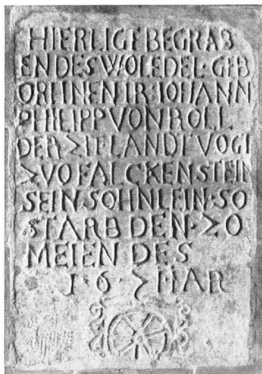
Antonius-Kapelle in Balsthal. Die instandgestellte Grabplatte des Knäbleins Johann Philipp von Roll aus dem Jahre 1671.

Dans la chapelle de Balsthal, une dalle funéraire de 1671 conserve la mémoire d'un petit garçon, Jean-Philippe de Roll.