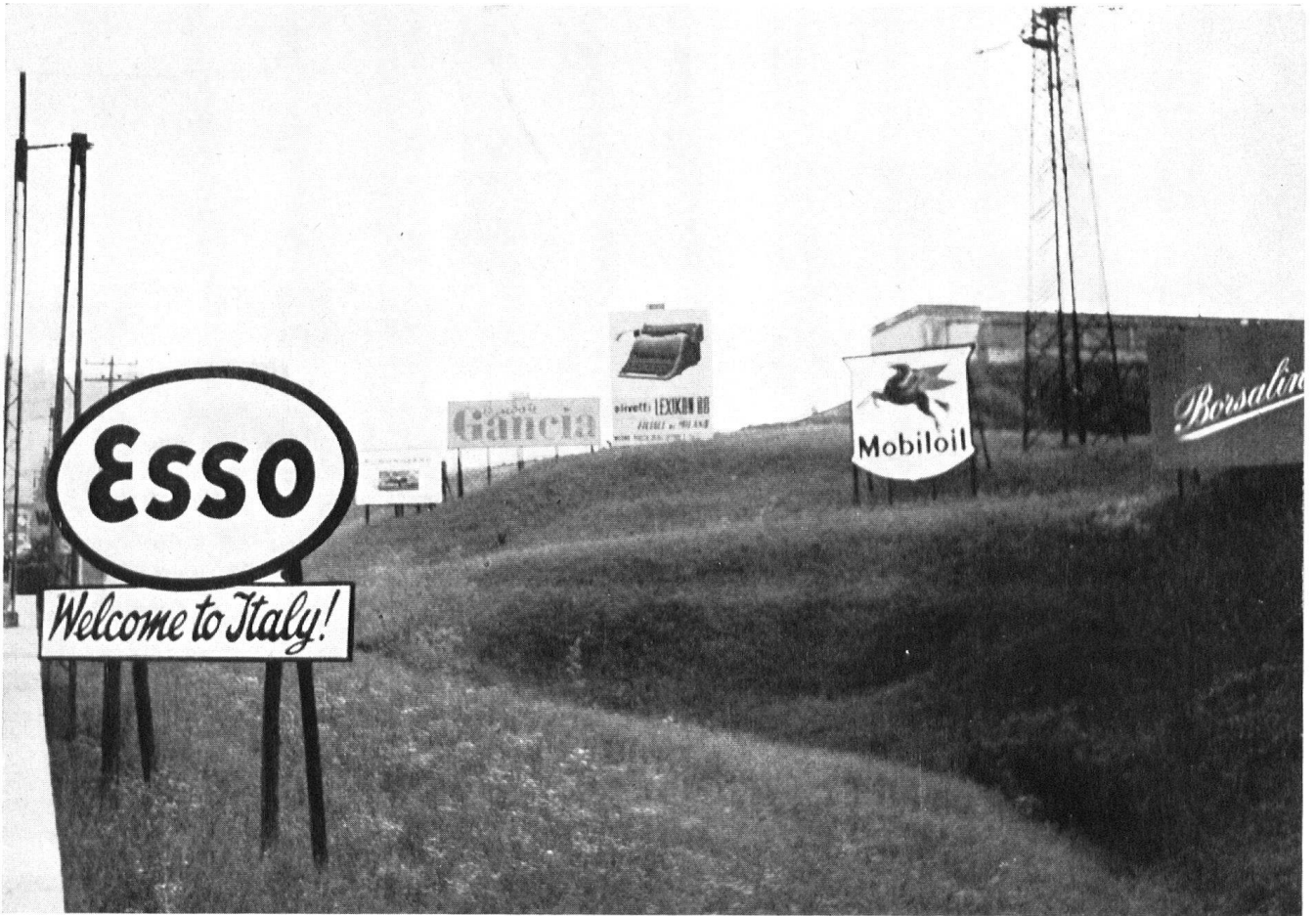
Das Empfangskomitee, das sich zwischen Chiasso und Como aufgestellt hat.