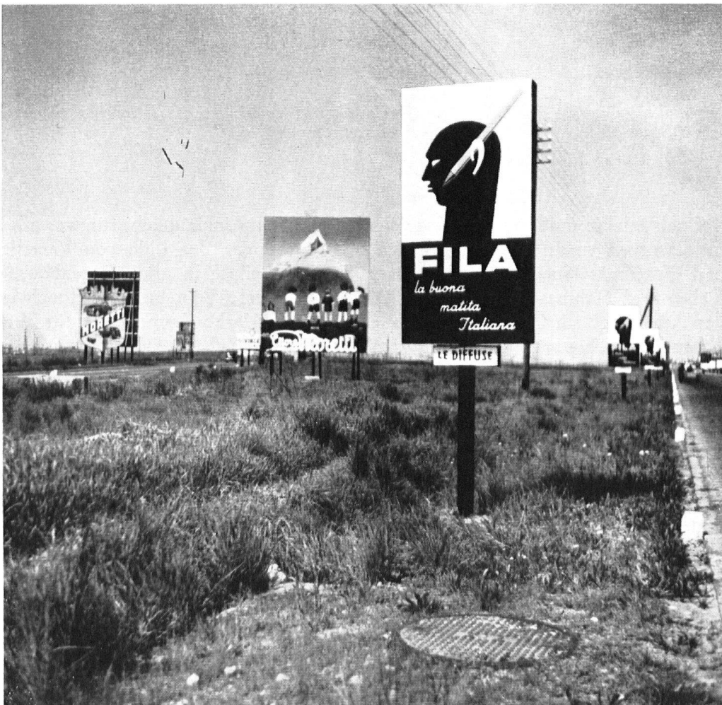
»Straßenlandschaft« zwischen Mailand und Como.

Doch wer auf den Autostraßen der Lombardei und jenseits der Apenninen fährt, der bekommt und hat genug, wirklich genug! Für den unschuldigen Schweizer und gar den Heimatschützer ist eine solche Reise einfach fürchterlich. Davon geben unsere Bilder einen bescheidenen Eindruck, wenn auch die Farben leider fehlen.