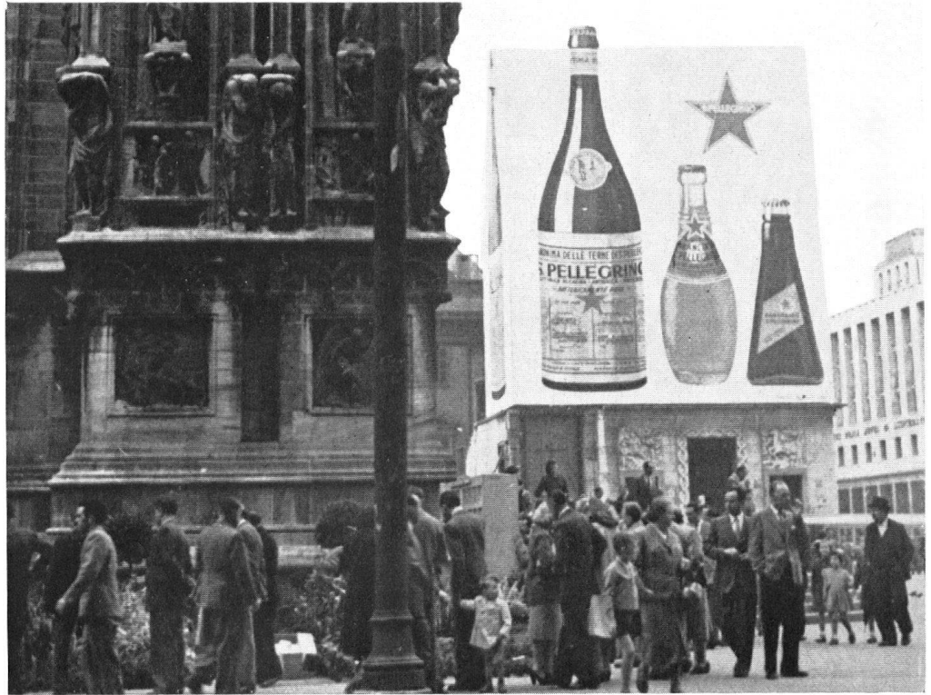
Oben: Der Dom von Mailand und seine Nachbarschaft. (Aufnahme Oktober 1951).

Encore la place du Dôme. Le proche voisinage de l'édifice religieux en octobre 1951.