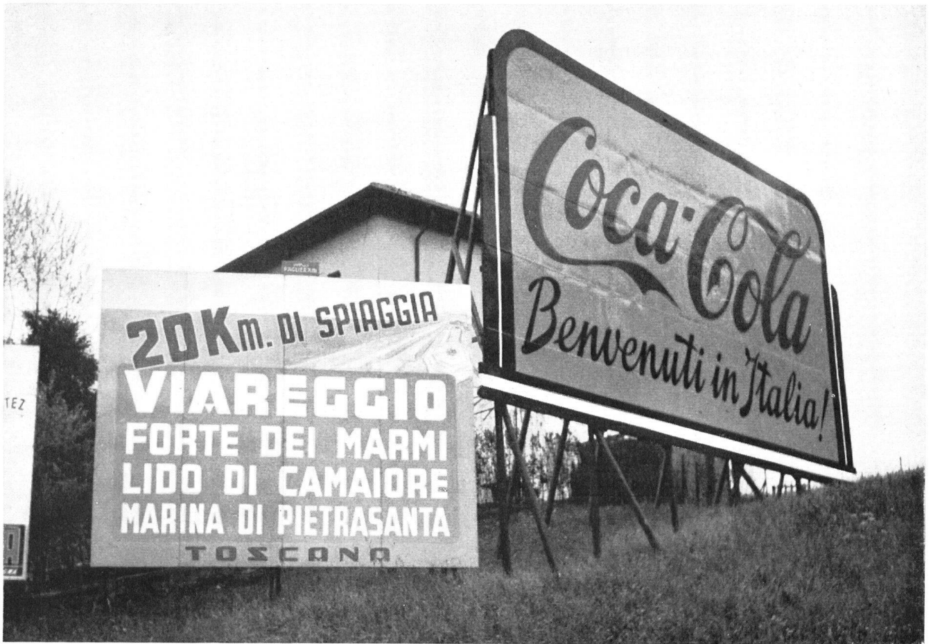
Wie der Schweizer in Italien empfangen wird. Coca-Cola C'est par la publicité américaine que le touriste suisse est heißt seine durstigen Freunde willkommen. accueilli en Italie.

Doch solches muß man im einzelnen beschreiben! Unglaublich, für was alles da geworben wird: für Gummisohlen und Autopneus, den Lido von Venedig und Textilmaschinen, Käse und Herrenhüte, Schnäpse in allen Regenbogenfarben und Nähmaschinen, deren glühendes Konterfei beinahe himmelhoch in den Äther ragt, für Coca-Cola und Büchsenfleisch (Marke Simmenthal), für Einrichtungen diskreter Örtchen und unzählbare menschliche Freuden. Wenn aber dann der Schweizer auf seiner italienischen Autofahrt auch noch bemerken muß, wie hochgeschätzte schweizerische Kurorte in das kläffende Reklamegeschrei einstimmen, kocht aus dem Lachen allmählich der Zorn. Und unwillkürlich stellt sich uns die Frage, wie es wohl an den eidgenössischen Straßen käme, wenn man nicht zeitig einen Riegel schöbe.