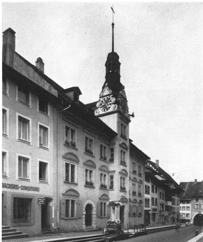
Das Rathaus von Lenzburg, erbaut 1677, das 1939—1941 von der Ortsbürger- und Einwohnergemeinde mit einem Kostenaufwand von Fr. 200 000.— innen und außen sorgfältig instandgestellt wurde.

La commune de Lenzbourg vient d'employer 200 000 fr. pour remettre en état son hôtel de ville. Construit en 1677, il a été restauré de 1939 à 1941.