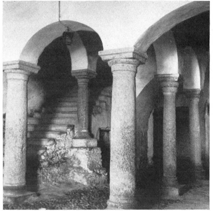
Porche et colonnade intérieure de la maison Rosenroll, dont la commune de Thuisis projette de faire un musée régional.

vom Standpunkte des Heimatschutzes voll anzuerkennen und zu begrüßen. Mitten unter den alten Häusern steht die einfache Brunnenform aus Granit, und auf den rechteckigen Brunnenpfosten erhebt sich die metallene Gestalt des Tusner Wappentieres, des Löwen, der ein Rad in der Pranke hält. Die Figur selbst ist vom Bruder des Bildhauers, Gian Pedretti, in Kupfer getrieben worden und hat die elementare Wirkung erhalten, die nur Handarbeit und Materialechtheit geben. Straff und kräftig reckt sich dieser moderne Löwe vor den alten Häusern; Brunnen, Tier und Bauten passen prächtig zusammen, wie wirkliche Kunstwerke es immer tun, mögen sie auch in verschiedenen Zeiten entstanden sein.