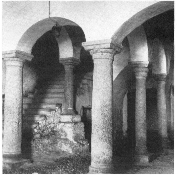
Porche et colonnade intérieure de la maison Rosenroll, dont la commune de Thuis projette de faire un musée régional.