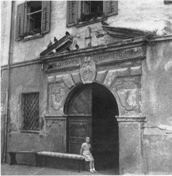
Das Rosenroll-Haus in Thuis. Unsere Bilder zeigen das Eingangstor und einen Blick in die Säulenhalle. Das Haus ist als zukünftiges Heimatmuseum der Gemeinde Thuis in Aussicht genommen.