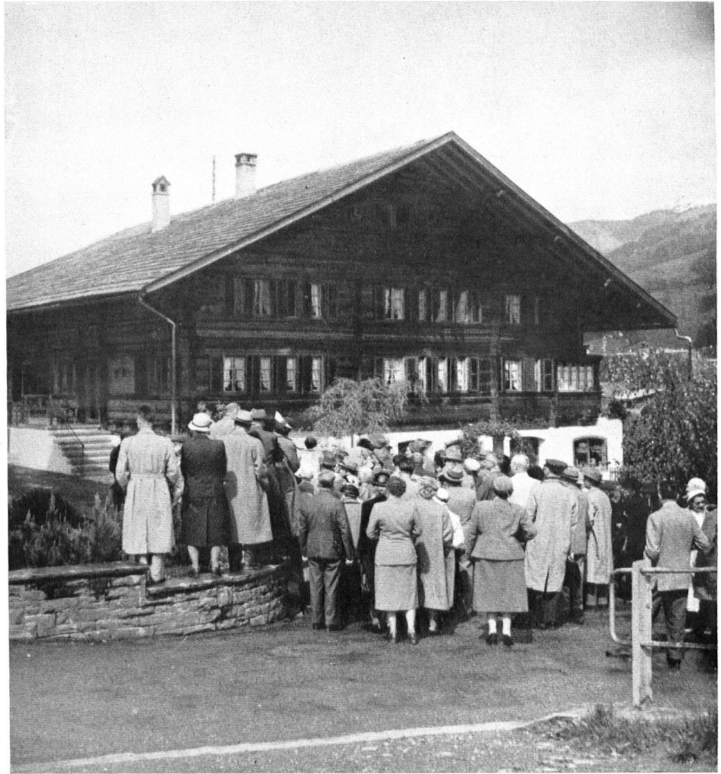
Besichtigung des instand- gestellten, reichgeschmück- ten Hauses »zur Farb« in Frutigen.