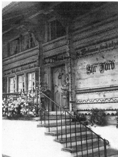
Haus »zur Farb«: Der Ein- gang und die prächtige Haustüre, in der sich Bauernkunst und Stil- formen des 18. Jahrhun- derts harmonisch vereinen.