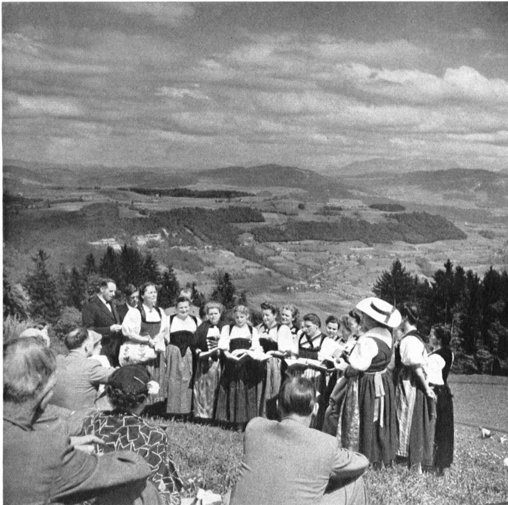
Mittagsrast auf dem Längenberg bei der Tavel- Gedenkstätte. Bauersleute erfreuen die Heimat- schützer mit ihren Liedern — O Täler weit, o Höhen!

gewählt, da Adrian von Bubenberg, der aus der Stadt Verbannte, von den reumütigen Bernern den Auftrag erhielt, er möchte, als der Tapferste und Wissendste von allen, Murten gegen den anrückenden Karl den Kühnen, seinen Jugendfreund, verteidigen. Die Worte des Dichters und der Sprecherin vereinigten sich zu ergreifender Wirkung, schöner hätte man den Sonntag nicht schließen können. —